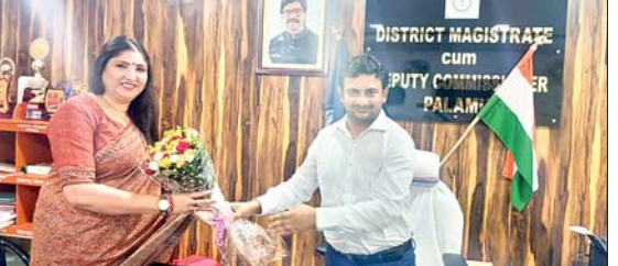
शहरी जलापूर्ति, वीआईपी रिंग रोड, स्विमिंग पुल युक्त स्पोर्ट्स कंप्लेक्स और ट्रैफिक सुदृढ़ करना प्राथमिकता