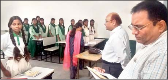
कस्तूरबा गांधी आवासीय विद्यालय में छात्राओं से बात करते आयुक्त व अन्य।