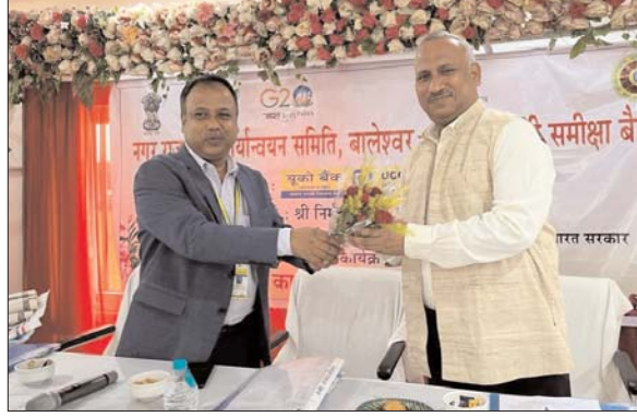
ग्राहकों को जोड़ते हुए उन्हें बैंकिंग सुविधाओं का लाभ दे रहे हैं। अपने देश की भाषा में काम करना राष्ट्र का सम्मान करना है क्योंकि अपनी भाषा अपना देश देता है गौरव का संदेश। अपने देश

भुवनेश्वर। कहा जाता है कि भाषा भावों की वाहिका होती है। यह हमारे व्यवसाय वृद्धि में साधक है। हिंदी भारत की राजभाषा है और राजभाषा का कार्यान्वयन करना हम सभी का परम दायित्व है। पूरे भारत को एक भाषा के सूत्र में पिरोने के लिए हम सभी को एकजुट होकर प्रयास करना होगा। हिंदी बहुत ही सरल सुगम और मधुर भाषा है। इसे हम आसानी से समझ सकते हैं। अपनी बातों को दूसरों के सामने रख सकते हैं। हिंदी और क्षेत्रीय भाषाएं व्यवसाय वृद्धि में महत्वपूर्ण भूमिका निभाती हैं। क्योंकि अपनी भाषा अपना देश देता है गौरव का संदेश। अपने देश