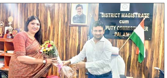
शहरी जलापूर्ति, वीआईपी रिंग रोड, स्विमिंग पुल युक्त स्पोर्ट्स कंप्लेक्स और ट्रैफिक सुदृढ़ करना प्राथमिकता