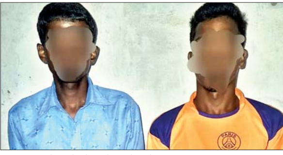
वृद्ध की हत्या के आरोप में पकड़े गए दो आरोपित।