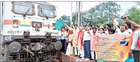
खलारी स्टेशन का जीर्णोद्धार अमृत भारत स्टेशन योजना के तहत कराया जाएगा। उन्होंने बताया कि वे विशेष पहल कर खलारी को इस योजना के तहत अपग्रेड कराएंगे। अभी सांसद के विशेष सत्र में ही वे मैकलुस्कीगंज रेलवे स्टेशन पर बरकाकाना-पटना पलामू एक्सप्रेस तथा जबलपुर-हावड़ा शक्तिपुंज एक्सप्रेस के ठहराव की बात रखेंगे। वहीं जल्द ही राय में अंडर पास निर्माण के लिए शिलान्यास

आजाद सिपाही संवाददाता खलारी। सांसद संजय सेठ मंगलवार को खलारी दौर पर थे। इस दौरान वे खलारी रेलवे स्टेशन पर स्वर्ण जयंती हटिया-आनंद विहार एक्सप्रेस का ठहराव शुरू होने पर ट्रेन को हरी झंडी दिखाते पहुंचे। सांसद ने सैकड़ों भाजपा कार्यकर्ताओं के बीच पहले दिन के ठहराव के बाद स्वर्ण जयंती एक्सप्रेस को हरी झंडी दिखाकर रवाना किया। इस दौरान एक्सप्रेस चालकों को माला पहनाकर स्वागत किया गया। वहीं, सांसद संजय सेठ ने आश्वासन देते हुए कहा कि 8.5 अरब सालाना राजस्व देने वाले खलारी रेलवे स्टेशन के दिन बहुरेंगे वाले हैं।