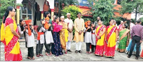
अर्चना की। उन्होंने कहा कि ऐसे विद्यालयों का विकास करने से देश का विकास होगा। यहां शिक्षा ही नहीं बल्कि भारत की संस्कृति,

खलारी (आजाद सिपाही)। सरस्वती शिशु विद्या मंदिर प्रांगण में मंगलवार को सांसद मद योजना अंतर्गत प्रशासनिक भवन का उद्घाटन सांसद रांची संजय सेठ ने किया। इससे पूर्व सांसद संजय सेठ के विद्यालय पहुंचने पर विद्यार्थियों द्वारा घोष, बैड, स्वागत गान एवं स्वागत भाषण के साथ पुष्प गुच्छ, श्रीफल देकर किया गया। जिसके बाद सांसद संजय सेठ ने मां सरस्वती की पूजा