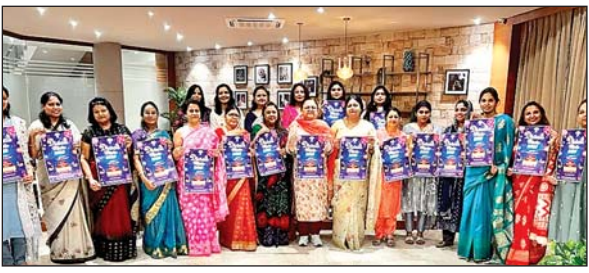
जायेंगे। जिसमें झारखंड राज्य एवं देश के कोने-कोने में प्रचलित लोक कलाओं से संबंधित उत्पाद, देश के

रांची। झारखंड आइएएस ऑफिसर्स वाइव्स एसोसिएशन (जेसोवा) ने दीवाली मेला-2023 का पोस्टर मंगलवार को रिलीज किया गया। इस कार्यक्रम में संस्था की प्रेसिडेंट, सेक्रेटरी, ज्वॉइंट सेक्रेटरी, ट्रेजरर एवं अन्य सदस्य उपस्थित रहे। मोरहाबादी मैदान में 2 से 6 नवंबर तक दीवाली मेला का आयोजन किया जायेगा। इस पांच दिवसीय मेले में 200 से ज्यादा स्टॉल लगाये