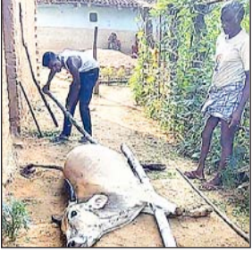
रंका अनुमंडल स्तर पर मात्र एक पशु चिकित्सक के भरोसे विभाग चल रहा है। इस स्थिति में एआई पाल सीमेंट डालने वाले पशु कर्मियों की चांदी कट रही है। ये पाल सीमेंट डालने वाले एआई पशु कर्मचारी अपने को सरकारी डॉक्टर कहकर प्रचारित करते हैं और भोले

रंका। रंका प्रखंड में इन दिनों गाय, बैल, बकरी आदि में विभिन्न प्रकार की बीमारियां फैली हुई हैं। इस मौसम में पशुओं में होने वाली बीमारियों में चेचक, पतला दस्त, जख्म, सांस फूलना आदि असर देखा जा सकता है। चेचक से पशुओं को बुखार और फिर जखम हो जाती है जिसे देखभाल ध्यान नही दिया गया तो जखम बढ़ने का डर बना रहता है। गाय बैलों में सांस बढ़ने वाली बीमारी भी देखा जा सकता है। बकरियों में पेट झरने तथा पतला दस्त की बीमारी चल रही है जो जल्द ठीक नहीं होती है। रंका प्रखंड की बात नहीं बल्कि