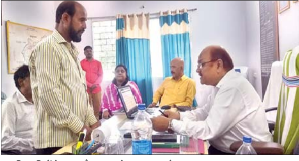
पदाधिकारियों के साथ बैठक करते आयुक्त मनोज जायसवाल।

- आयुक्त ने पाटन अंचल कार्यालय का किया निरीक्षण - इस संबंध में कार्यशाला का होगा आयोजन आजाद सिपाही संवाददाता