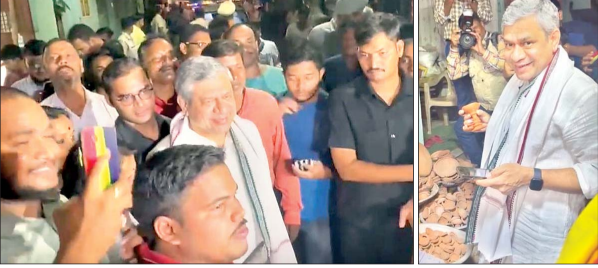
रेल, संचार, इलेक्ट्रॉनिक्स और सूचना प्रौद्योगिकी मंत्री अश्विनी वैष्णव शनिवार की शाम भुवनेश्वर के कपिलेश्वर गांव पहुंचे और सीधे कुम्हार के घर पहुंचे। वहां उन्होंने कुम्हार के साथ चाक चलायी और खरीदारी कर आनलाइन पैंट भी किया। बता दें कि अपनी यात्रा के दौरान वर रविवार को सुबह 11 बजे रेलवे ऑडिटोरियम, चंद्रशेखरपुर, भुवनेश्वर में विश्वकर्मा योजना के शुभारंभ के लिए एमएसएमई कार्यक्रम में भाग लेंगे। अश्विनी वैष्णव इस योजना के बारे में कलाकारों और शिल्पकारों से भी बातचीत करेंगे, जो स्थानीय समुदाय और रेलवे उत्साही लोगों के लिए एक उल्लेखनीय क्षण होगा। सफाई और स्वच्छता को बढ़ावा देने के लिए अश्विनी वैष्णव लोकल ट्रेन में स्वच्छता अभियान का नेतृत्व करेंगे और भुवनेश्वर से कटक तक यात्रा करेंगे। ट्रेन दोपहर 2:30 बजे भुवनेश्वर से रवाना होगी और कटक तक जायेगी और यात्रियों को मंत्री के साथ बातचीत करने का अवसर मिलेगा। वैष्णव यात्रियों को स्वच्छता अभियान और उसके महत्व के बारे में जानकारी देंगे। वैष्णव कटक रेलवे स्टेशन पर स्वच्छता अभियान में भी भाग लेंगे।