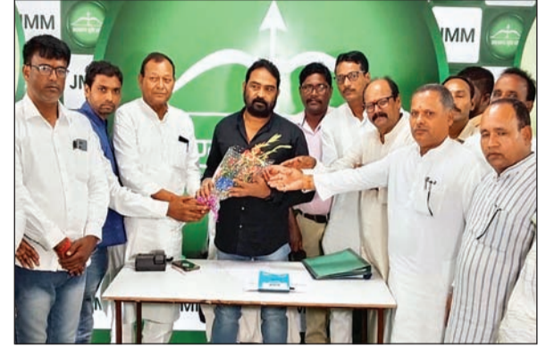
इसमें चतरा और कोडरमा जिला में संगठन की मजबूती पर चर्चा की गयी। साथ ही जिला समिति द्वारा क्षेत्र में किये जा रहे कार्यों का आकलन किया गया। साथ ही सभी उपस्थित पदाधिकारी तथा सदस्यों को झारखंड सरकार द्वारा जनहित में लायी गयी योजनाओं की जानकारी देते हुए आमजनों तक योजनाओं को पहुंचाने का निर्देश दिया गया। आगामी दिनांक 20 सितंबर को पलामू और गढ़वा जिला समिति की विस्तारित बैठक आयोजित की जायेगी।

रांची। झामुमो जिला समिति की विस्तारित बैठक के दूसरे दिन शनिवार को चतरा और कोडरमा जिला समिति की विस्तारित बैठक हुई। पार्टी के केन्द्रीय महासचिव विनोद कुमार पांडेय की अध्यक्षता में रांची के हरमू स्थित पार्टी के केन्द्रीय कार्यालय में बैठक संपन्न हुई। इसमें जिला अंतर्गत केन्द्रीय समिति के सभी सदस्य, जिला समिति के सभी पदाधिकारी और वर्ग संगठन के जिलाध्यक्ष और सचिव सहित अन्य बैठक में शामिल रहे।