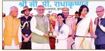
सिर्फ संथाल परगना बल्कि सीमावर्ती राज्य के लोग भी लाभान्वित होंगे। राज्यपाल ने एम्स देवघर परिवार को बधाई दी तथा संस्थान के उज्वल भविष्य की कामना की। उक्त अवसर पर राज्यपाल ने एम्स देवघर में नवनिर्मित नर्सिंग छात्रावास का उद्घाटन किया एवं कार्यक्रम में प्रतिभाशाली विद्यार्थियों को सम्मानित भी किया।

देवघर (आजाद सिपाही)। राज्यपाल सीपी राधाकृष्णन ने शनिवार को एम्स देवघर के चतुर्थ वार्षिकोत्सव का उद्घाटन किया। इस मौके पर समारोह को संबोधित करते हुए कहा कि हमारे समाज में विकित्सकों को सम्मान की दृष्टि से देखा जाता है। उन्होंने कहा कि भारत के अनेक विकित्सकों ने अपने उल्लेखनीय योगदान से विश्व में अपनी विशिष्ट पहचान स्थापित की है। विकित्सकों व स्वास्थ्य कर्मियों के कारण ही हम कैंसर महामारी के विषम परिस्थितियों का सफलतापूर्वक सामना करने में सफल हुए हैं। राज्यपाल ने कहा कि सुपर स्पेशियलिटी स्वास्थ्य के प्रसार एवं इसकी पहुंच को बढ़ावा देने के उद्देश्य के तहत विभिन्न राज्यों में नये एम्स संस्थान स्थापित किये गये हैं और एम्स देवघर की स्थापना से न