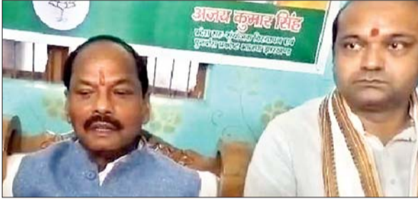
प्रत्कारों से सवालों का जवाब देते पूर्व मुख्यमंत्री रघुवर दास व अन्य।

महुदा। धनबाद से रांची जाने के क्रम में शुक्रवार को झारखंड सरकार की 108 डायल एंगुलेंस सेवा की लचर व्यवस्था के चलते आठ महीने की गर्भवती महिला की हुई मौत पर झारखंड के पूर्व मुख्यमंत्री रघुवर दास ने गहरा दुःख प्रकट किया। लगे हाथ झारखंड की वर्तमान गठबंधन सरकार के खिलाफ जमकर जुबानी हमला किया। कहा कि जनता इस सरकार से पूरी तरह त्रस्त हैं। यहां स्वास्थ्य विभाग में चलने वाली एंगुलेंस के चालकों को पांच-पांच महीनों से वेतन नहीं मिला है। वाहन की दशा भी ठीक-ठाक नहीं रहती। आपातकालिन