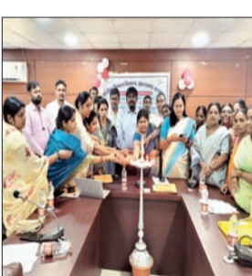
आवास योजना अंतर्गत सभी अपूर्ण आवासों को 15 सितंबर से 10 अक्टूबर तक पूर्ण कराना है। इस दौरान सभी से अनुरोध किया गया की अभियान को सफल बनाने के लिए अपूर्ण आवास के लाभुक को आवास पूर्ण करने के लिए प्रेरित करें। पंचायत, गांव, टोला स्तर पर लाभुकों को आवास पूर्ण करने के निमित्त हर सहायता

मेदिनीनगर (आजाद सिपाही)। पलामू जिले में प्रधानमंत्री ग्रामीण आवास योजना के तहत अभियान चलाकर अपूर्ण आवासों को पूर्ण किया जायेगा। इसे लेकर शुक्रवार को समाहरणालय ब्लॉक सी सभागार में बैठक कर चलो करें आवास पूरा अभियान का शुभारंभ किया गया। बैठक में जिला परिषद अध्यक्ष, डीडीसी सभी प्रखंडों के प्रमुख, उपप्रमुख, परियोजना पदाधिकारी, जिला समन्वयक प्रशिक्षण उपस्थित रहे, जबकि सभी बीडीओ, प्रखंड समन्वयक वीडियो कांफ्रेंसिंग के माध्यम से जुड़े। बैठक में डीडीसी ने अभियान से संबंधित विस्तृत जानकारी साझा की। कहा कि अभियान का उद्देश्य प्रधानमंत्री