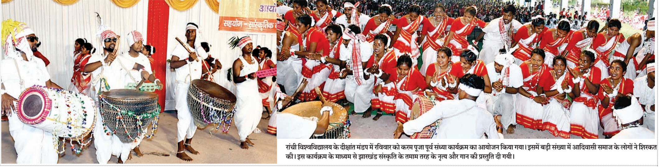
रांची विश्वविद्यालय के दीक्षांत मंडप में रविवार को करम पर्व संख्या कार्यक्रम का आयोजन किया गया। इसमें बड़ी संख्या में आदिवासी समाज के लोगों ने शिरकत की। इस कार्यक्रम के माध्यम से झारखंड संस्कृति के तमाम तरह के नृत्य और गान की प्रस्तुति दी गयी।