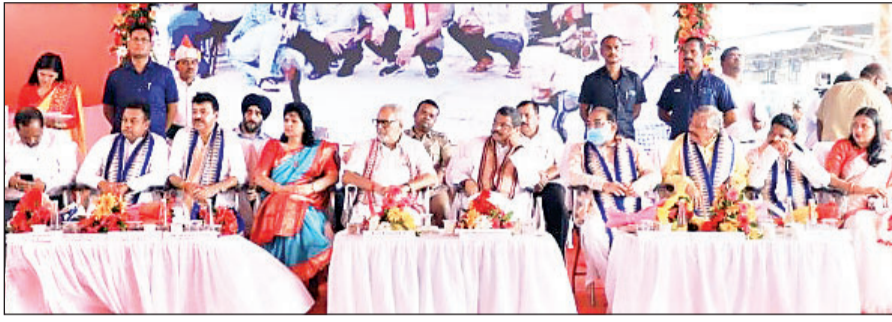
भुवनेश्वर रेलवे स्टेशन पर शामिल हुए, जहां पुरी-राउरकेला मार्ग पर ओड़िशा के लिए दूसरी वंदे भारत एक्सप्रेस का शुभारंभ किया गया। राउरकेला-पुरी वंदे भारत एक्सप्रेस के अलावा,

आजाद सिपाही संवाददाता भुवनेश्वर। प्रधानमंत्री नरेंद्र मोदी ने रविवार को वीडियो कॉन्फ्रेंसिंग के माध्यम से ओड़िशा सहित 11 राज्यों में नौ वंदे भारत ट्रेनों को हरी झंडी दिखाई, जिससे इन सेमी हाई-स्पीड ट्रेनों की कुल संख्या 34 हो गयी है। इस कार्यक्रम में राज्यपाल प्रफेसर गणेशी लाल, केंद्रीय शिक्षा और कौशल विकास और उद्योगिता मंत्री श्री धर्मेंद्र प्रधान के साथ कई सांसद विधायक