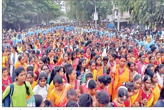
करम महोत्सव डहरे करम बेड़हा में उमड़ा लोगों का हजूम।

बोकारो। वृहद झारखंड कला सांस्कृतिक मंच की ओर से रविवार को करम महोत्सव डहरे करम बेड़हा का आयोजन किया। सांस्कृतिक कार्यक्रमों के बीच आकर्षक झांकियों के साथ करम शोभायात्रा निकाली गई, जो चास के आइटीआई मोड़ से बिरसा चौक नया मोड़ पहुंचकर करम आखड़ा में तब्दील हो गई। इस अवसर पर 15-20 लोगों की करम टीम ने जावा के साथ भाग लिया। पारंपरिक वेसभूषा के साथ सभी मांदा की थाप पर करम गीतों की धुन पर थिरकते नजर आये। इस अवसर पर 500 से अधिक मांदा, ढोल, नगाड़ा के साथ निकली भव्य करम रैली में उमड़े लोगों के हजूम के साथ