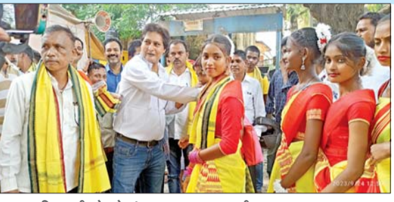
भासस परिवार की ओर से बांटा जा रहा गमछा-पानी।

थाप पर थिरककर अपनी मां, माटी, मानुष और मातृभाषा के प्रति सम्मान प्रकट करते हैं। लोगों की जबदस्त भागीदारी के लिए उनका आभार प्रकट करते हुए कहा कि झारखंड का सांस्कृतिक पर्व करम जावा भाई-बहनों के अटूट प्रेम को दर्शाता है। सावन के महीने में रिमझिम बारिश की फुहारों में खेतों में खेती करके