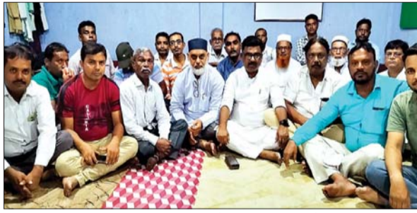
हजरत मोहम्मद साहब का जन्मदिवस की तैयारियों को लेकर बैठक करते लोग।