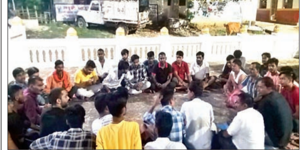
बैठक में कार्यक्रम की रूपरेखा तैयार करते लोग।