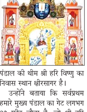
पंडाल की थीम श्री हरि विष्णु का निवास स्थान क्षीरसागर है। उन्होंने बताया कि सर्वप्रथम हमारे मुख्य पंडाल का गेट लगभग 80 फीट चौड़ा है, जो श्री हरि विष्णु के तिरुपति बालाजी प्रतिमा के प्रारूप की तर्ज पर निर्माण किया जा रहा है। तिरुपति बालाजी