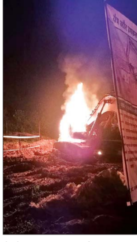
धु-धुक जलता वाहन।

मैकलुस्कीगंज। मैकलुस्कीगंज थाना क्षेत्र के चट्टी नदी के समीप थर्ड रेल लाइन के काम में लगे कंपनी की गाड़ियों को नक्सलियों ने आग लगा दिया। चट्टी नदी के पास केड्री कंपनी के अंतर्गत विभीभी कंपनी का थर्ड रेल लाइन बनाने का काम चल रहा है। घटना सोमवार की रात सात बजे की बताया जा रही है। जानकारी के अनुसार 12-15 की संख्या में आये हथियारबंद लोगों ने साईट पर पहुंचकर फायरिंग करते हुए गाड़ और कर्मचारियों के साथ मारपीट की। उनका मोबाइल फोन भी छीन लिया। इसके बाद हथियारबंद लोगों ने एक कोपलेन, एक हाइवा, एक क्रेटा और एक डीजी जेनरेटर को आग के हवाले कर दिया। घटना के बाद सभी