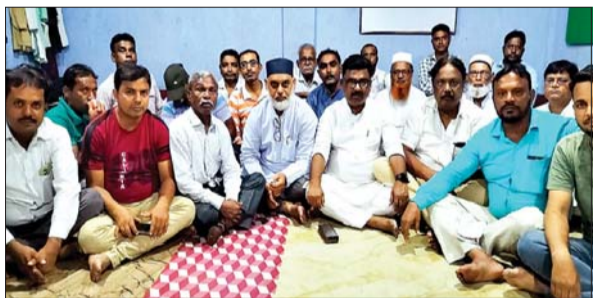
हजरत मोहम्मद साहब का जन्मदिवस की तैयारियों को लेकर बैठक करते लोग।

-सर्वसम्मति से 16 पंचायत की बैठक में लिया गया निर्णय - सभी जुलूस को सामूहिक हुआ ओं होना होगा शामिल आजाद सिपाही संवाददाता लोयाबाद। लोयाबाद की 16 पंचायत की बैठक रविवार की देर शाम लोयाबाद मदरसा अल जामेअतुल कादिरिया अजीजूल उल्मु हल में हुई। कमेटी के अध्यक्ष इतिहास अहमद की अध्यक्षता में आयोजित बैठक में सभी पंचायतों के सदर सचिव और सदस्य मौजूद थे। सभी पदाधिकारियों और सदस्यों के सर्वसम्मति से निर्णय लिया कि 28 सितंबर को ईद मिलादुन्नबी (हजरत मोहम्मद साहब का जन्मदिवस) हर्षोल्लास के साथ मनाया जाएगा। इस अवसर पर निकाली जाने वाली जुलूस-ए-