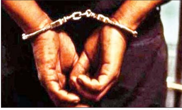
छापामारी करने का निर्देश दिया। बड़कागांव एसडीपीओ के नेतृत्व