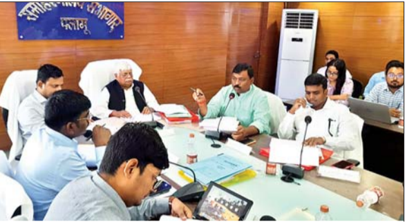
दिशा की बैठक में अधिकारियों को जरूरी निर्देश देते सांसद वीडी राम व अन्य।

मेदिनीनगर। पलामू जिला विकास समन्वय एवं निगरानी समिति (दिशा) की बैठक बुधवार को समाहरणालय सभागार में हुई। जिसकी अध्यक्षता पलामू सांसद विष्णु दयाल राम ने की। इस दौरान जिले में आम लोगों के लिए चलायी जा रही योजनाओं की समीक्षा की गयी। कुछ योजनाओं की धीमी प्रगति पर सांसद ने नाराजगी जाहिर करते हुए संबंधित अधिकारी से सवाल-जवाब भी किया। साथ ही पिछली बैठक में लिए गये निर्णयों एवं अनुपालन पर भी चर्चा की। बैठक में महात्मा गांधी राष्ट्रीय ग्रामीण रोजगार गारंटी योजना, प्रधानमंत्री ग्राम सड़क योजना, सामाजिक सुरक्षा पेंशन, प्रधानमंत्री ग्रामीण आवास योजना, स्वच्छ भारत मिशन, राष्ट्रीय ग्रामीण पेयजल कार्यक्रम,