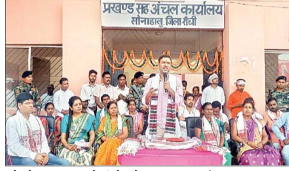
हमें शोषण, अत्याचार के विरोध में लड़ने की शक्ति प्रदान करेगा। इस क्रम में प्रखंड के जिला परिषद सदस्य, पूर्व सदस्य, प्रमुख, उपप्रमुख, मुखिया, पंचायत समिति, वार्ड सदस्य, ग्रामप्रधान