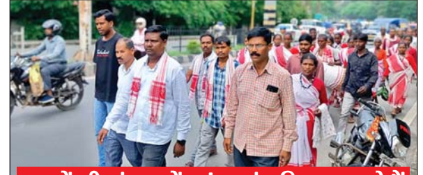
लाखों की संख्या में भुइंहर मुंडा निवास करते हैं

रांची। भुइंहर मुंडा को झारखंड की अनुसूचित जनजाति की सूची में शामिल करने की मांग को लेकर शुक्रवार को राज्यभर से आये सैकड़ों लोग मुख्यमंत्री आवास पहुंचे। उनका कहना है कि अनुसूचित बिहार में उनका जाति और आवास प्रमाण पत्र बनता था, लेकिन झारखंड अलग राज्य बनने के बाद से हम लोगों को अनुसूचित जनजाति की सूची से बाहर कर दिया गया है। राज्य सरकार हम लोगों को न एसटी, न ओबीसी और न ही जेनरल मानती है। हम लोगों का जाति और आवास प्रमाण पत्र भी नहीं बन रहा है। इसके चलते बच्चों को स्कूल-कॉलेज में पढ़ाने में मुश्किल हो रहा है। छात्रवृत्ति फार्म भी नहीं भर पा रहे हैं। ऐसे में हम लोगों के सामने विश्वास के अलावा कुछ भी नहीं दिख रहा है।