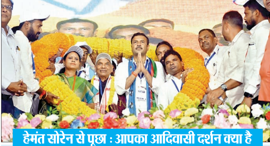
हेमंत सोरेन से पूछा : आपका आदिवासी दर्शन क्या है

रांची। शासन कमजोर, गैर जवाबदेह, भ्रष्टाचार में संलिप्त हो और बेलगाम प्रशासन के हाथों खेलता हो, आम आदमी, पंच, गांव की चौपाल की सत्ता में भागीदारी नहीं हो, तो वहां सुशासन की बात बेमानी होगी। हेमंत सोरेन की सरकार में झारखंड की यही तस्वीर उभरी है। सुशासन और स्वशासन में आम सहमति, जवाबदेही महत्वपूर्ण होती है। हम और हमारी पार्टी ने नवनिर्माण के नौ संकल्पों के साथ स्वशासन से सुशासन का लक्ष्य रखा है। इसमें झारखंडी हक और अधिकार सुनिश्चित किये जायेंगे। राज्य के सपनों को जमाने के लिए आजसू पार्टी आगे बढ़ चुकी है। महाधिवेशन के आखिरी दिन अपने संबोधन में आजसू पार्टी के केंद्रीय अध्यक्ष सुदेश कुमार महतो ने ये बातें कहीं। सुदेश कुमार महतो ने कहा कि सुशासन से मेरा मतलब झारखंडी विचारों, विषयों, आम सहमति, जवाबदेही, उत्तरदायी का अनुसरण और आम आदमी को सत्ता का भागीदार बनाना होगा। सामाजिक न्याय और विकास आधारित होगा। उन्होंने कहा कि गिव एंड टेक की पॉलिटेक्स करने वालों को हमारे महाधिवेशन और विचार मंथन का समझ नहीं हो सकता। राजनीतिक परिदृश्य परतंत्र भारत में स्वतंत्रता संग्राम का उद्गम स्थल आज का झारखंड वर्तमान समय में राजनीतिक भटकाव आर्थिक,