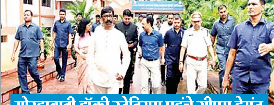
मोरहाबादी हॉकी स्टेडियम पहुंचे सीएम हेमंत

आजाद सिपाही संवाददाता रांची। रांची की मेजबानी में अक्टूबर में एशियन महिला हॉकी चैंपियनशिप होने जा रहा है। इस चैंपियनशिप को लेकर मोरहाबादी के मरांग गोमके जयपाल सिंह मुंडा एस्ट्रोटेड स्टेडियम का रेनोवेशन चल रहा है। सोमवार को मुख्यमंत्री हेमंत सोरेन ने इस हॉकी स्टेडियम का निरीक्षण किया। निरीक्षण के दौरान उन्होंने स्टेडियम की व्यवस्था से जुड़े कई अहम दिशा-निर्देश दिये। मुख्यमंत्री ने कहा कि मरांग गोमके जयपाल सिंह मुंडा एस्ट्रोटेड स्टेडियम में खिलाड़ियों और दर्शकों के लिए आधुनिक ब्लू टर्फ का निरीक्षण किया। इस दौरान अंतरराष्ट्रीय स्तर की सुविधाएं प्रदान करना राज्य सरकार की प्राथमिकता है।