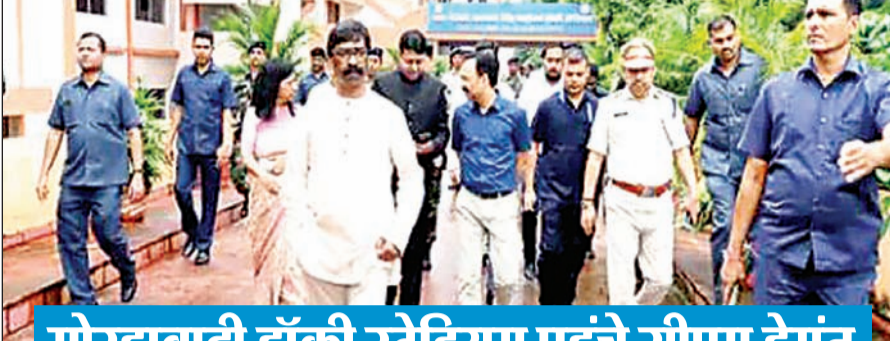
मोरहाबादी हॉकी स्टेडियम पहुंचे सीएम हेमंत

आजाद सिपाही संवाददाता रांची। रांची की मेजबानी में अक्टूबर में एशियन महिला हॉकी चैंपियनशिप होने जा रहा है। इस चैंपियनशिप को लेकर मोरहाबादी के मरांग गोमके जयपाल सिंह मुंडा एस्टेट स्टेडियम का रेनोवेशन चल रहा है। सोमवार को मुख्यमंत्री हेमंत सोरेन ने इस हॉकी स्टेडियम का निरीक्षण किया। निरीक्षण के दौरान उन्होंने स्टेडियम की व्यवस्था से जुड़े कई अहम दिशा-निर्देश दिये। मुख्यमंत्री ने कहा कि मरांग गोमके जयपाल सिंह मुंडा एस्टेट स्टेडियम में खिलाड़ियों और दर्शकों के लिए अंतरराष्ट्रीय स्तर की सुविधाएं प्रदान करना राज्य सरकार की प्राथमिकता है।