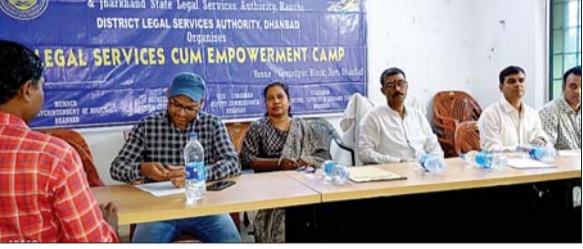
विधिक सशक्तिकरण सह जागरूकता शिविर में उपस्थित गणमान्य लोग।