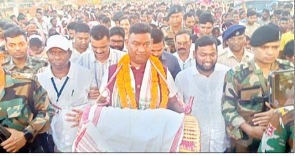
मांदर बजाते श्रम मंत्री सत्यानंद भोक्ता।