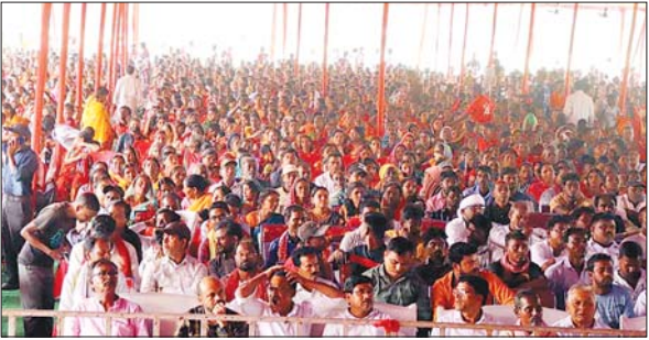
मासस ने कराया अपनी ताकत का एहसास आइएनडीआइए गठबंधन के माथे पर पड़ेगा बल

सुखाइ घोषित किया जाए। इसके लिए धनबाद सहित राज्य भर में विस्थापित होने वाले गांव के लोगों को रोजगार मुहैया कराया जाए। उन्होंने कहा कि झारखंड से केंद्र सरकार को 40 प्रतिशत टैक्स जाता है फिर भी यहां बेरोजगारी है। कहा कि आगे भी इसी तरह से हम सभी एकजुट रहेंगे तो हमें कामयाबी मिलेगी।