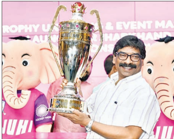
हॉकी इंडिया के प्रति आभार जताया

रांची। मुख्यमंत्री हेमंत सोरेन ने कहा है कि झारखंड खनिज संपदा के लिए अधिक जाना जाता रहा है। यह राज्य देश को अलग ताकत प्रदान करता है। जब इस राज्य में हमारी सरकार बनी तो पूरा विश्व कोरोना संक्रमण की चपेट में जूझता रहा। हम सभी लोग डेढ़ वर्ष तक अपने घरों में बंद रहने पर मजबूर हुए, परंतु इस कड़ी में हमने अपनी सोच पर ताले बंद नहीं किये। हमारी सरकार ने राज्य को किस दिशा में लेकर जाना है, उसकी तस्वीर खींची। हमारी सरकार ने इस क्रम में एजुकेशन, हेल्थ आधारभूत संरचना, पर्यटन तथा खेल के विकास के लिए कार्य करने की पूरी योजना तैयार की। राज्य सरकार की ओर से जब यहां के खिलाड़ियों को तराशने का कार्य प्रारंभ हुआ, तब पता चला कि खिलाड़ियों को तराशना यहां की खनिज संपदा से कहीं अधिक मूल्यवान है। मुख्यमंत्री शुक्रवार को झारखंड मंत्रालय स्थित