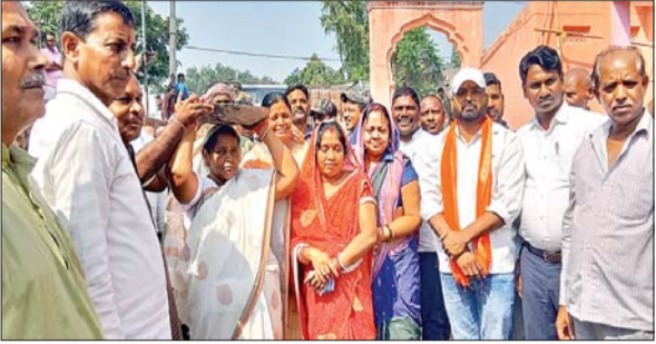
सिर पर मिट्टी की कड़ाही ढोकर निर्माण कार्य का शुभारंभ करती मंत्री बेबी देवी।

आजाद सिपाही संवाददाता नावाडीह/बेरमो। झारखंड की उत्पाद एवं मद्य निषेध मंत्री बेबी देवी ने नावाडीह सार्वजनिक दुर्गा मंदिर परिसर के सौंदर्यीकरण कार्य का शुभारंभ पूजा व पहली कड़ाही ढोकर किया। बताते चलें कि मंदिर के सौंदर्यीकरण कार्य में पूजा समिति को मंत्री बेबी देवी एवं गिरिडीह सांसद चंद्रप्रकाश चौधरी द्वारा निजी कोष से सोमेट उपलब्ध कराया गया। इस अवसर पर दुर्गा मंदिर समिति के सदस्यों ने मंत्री सहित अन्य अतिथियों का फूल माला पहनाकर स्वागत किया। वहीं, मंत्री बेबी देवी ने कहा कि सार्वजनिक कार्य में सभी की