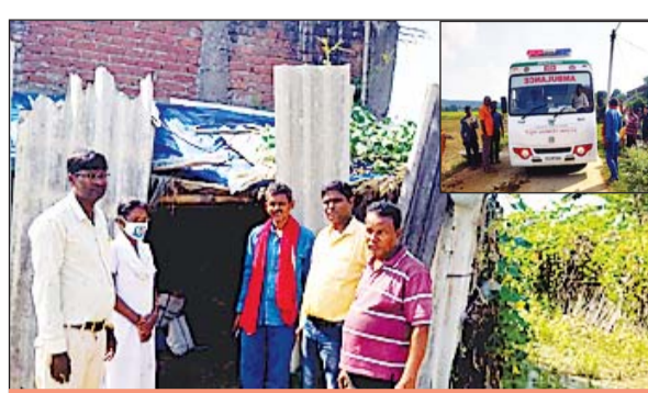
डायरिया से पीड़ित लोगों के घर का निरीक्षण करती स्वास्थ्य टीम