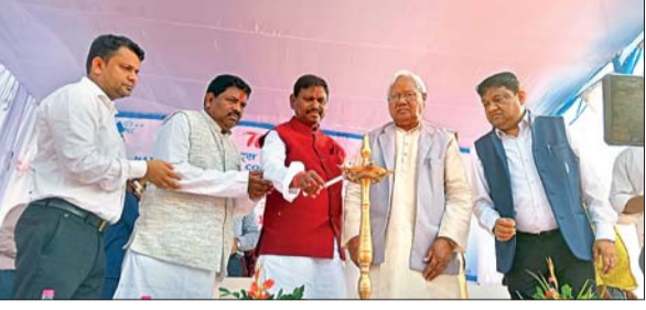
एकलव्य आदर्श विद्यालय का आधारशिला रखते केन्द्रीय मंत्री अर्जुन मुंडा व अन्य।

आजाद सिपाही संवाददाता खूंटो। केन्द्रीय जनजातीय मामलों के मंत्री अर्जुन मुंडा ने कहा कि जनजातीय क्षेत्रों के सभी प्रखंडों में एक-एक एकलव्य आदर्श आवासीय विद्यालय खोले जा रहे हैं। पूरे देश में 740 एकलव्य विद्यालय खोले जाएंगे। एक विद्यालय में 480 विद्यार्थी (240 छात्र और 240 छात्राएं) पढ़ेंगे। केन्द्रीय मंत्री शुक्रवार को तोरपा प्रखंड के सारिदकेल और मुरहू में एकलव्य आदर्श आवासीय विद्यालय के निर्माण की आधारशिला रखने के बाद जन सुवादय को संबोधित कर रहे थे। उन्होंने कहा कि एक-एक विद्यालय के निर्माण में 38 से 48 करोड़ रुपये की लागत आयेगी। आनेवाले समय में एकलव्य विद्यालय शिक्षा के क्षेत्र में मौल का पथर साबित होंगे और यहां से वैज्ञानिक, अभियंता, डॉक्टर आदि बनेंगे और देश का नाम रोशन करेंगे। केन्द्रीय मंत्री ने कहा कि पूरे देश में साढ़े तीन लाख बच्चे एकलव्य विद्यालयों में पढ़ेंगे। कहा