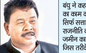
कागजात बना कर रैयतों को बेदखल किया जा रहा है, पूरे मामले को लेकर जांच करनी चाहिए। भारतीय जनता

बंधु ने कहा कि कांग्रेस सेवा का काम करती है भाजपा सिर्फ सत्ता के लालच में राजनीति करती है। यहां जो जमीन का मामला है और जिस तरीके से जमीन को सादा हुकुमनामा या फिर फर्जी कागजात बना कर रैयतों को बेदखल किया जा रहा है, पूरे मामले को लेकर जांच करनी चाहिए। भारतीय जनता