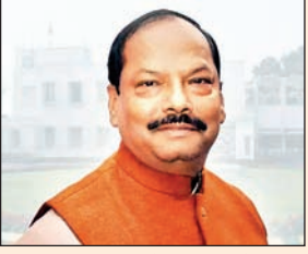
पूर्व मुख्यमंत्री और भाजपा के राष्ट्रीय उपाध्यक्ष रघुवर दास को

का पद संभाला और इन पांच सालों में राज्य का विकास तो