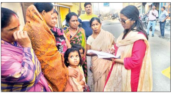
राशन कार्डधारियों का सत्यापन करती महिला अधिकारी।

बोकारो। जिले के सभी जन वितरण प्रणाली विक्रेताओं को शतप्रतिशत कार्डधारियों का सत्यापन कर मृत व्यक्तियों की पहचान करने का निर्देश दिया गया था। जिसके आलोक में दो दिनों से जन वितरण प्रणाली दुकानों की गहन जांच चल रहा है। इसी क्रम में चास, जरीडीह प्रखंड, कसमार एवं पेटरवार में गुरुवार, जबकि चंद्रपुर, नावाडीह एवं बेरमो के जन वितरण प्रणाली दुकानों का शुक्रवार को औचक निरीक्षण