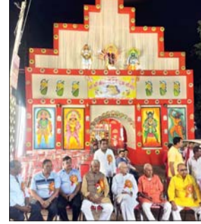
छरू नृत्य की थीम पर पूजा पंडाल