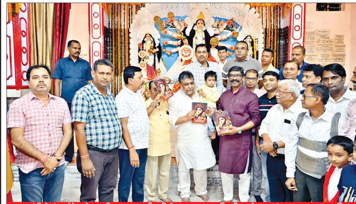
मुख्यमंत्री हेमंत सोरेन ने शारदीय नवरात्र की षष्ठी के अवसर पर हरिमती दुर्गा पूजा पंडाल, लालपुर का किया उद्घाटन। माता रानी के दरबार में मत्था टेककर राज्य की उन्नति, सुख-समृद्धि और शांति का आशीर्वाद मांगा।