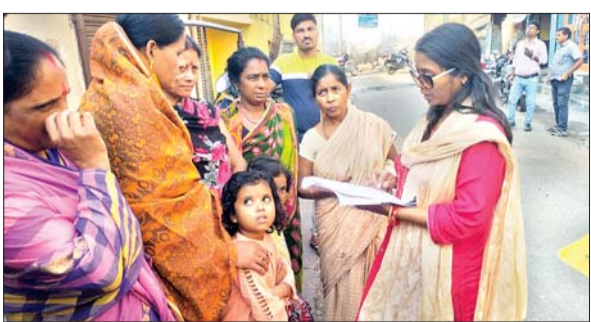
राशन कार्डधारियों का सत्यापन करती महिला अधिकारी।

बोकारो। जिले के सभी जन वितरण प्रणाली विक्रेताओं को शतप्रतिशत कार्डधारियों का सत्यापन कर मृत व्यक्तियों की पहचान करने का निर्देश दिया गया था। जिसके आलोक में दो दिनों से जन वितरण प्रणाली दुकानों की गहन जांच चल रहा है। इसी क्रम में चास, जरीडीह प्रखंड, कसमार एवं पेटरवार में गुरुवार, जबकि चंद्रपुरा, नावाडीह एवं बेरमो के जन वितरण प्रणाली दुकानों का शुक्रवार को औचक निरीक्षण