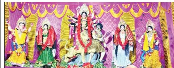
सुभाषनगर में स्थापित मां दुर्गा की प्रतिमा।