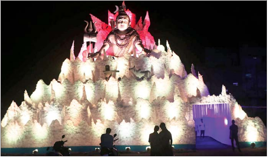
झरिया के चौथाई कुलिह तिवारी मंदिर में बना पूजा पंडाल।

कैमरे की नजर में धनबाद के विभिन्न जगहों की पूजा परिक्रमा