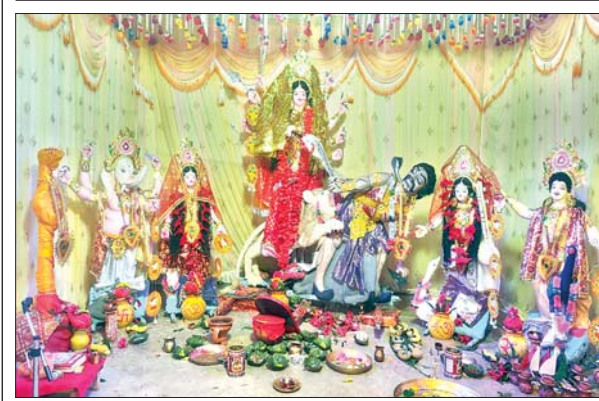
नावाडीह में स्थापित मां दुर्गा की प्रतिमा।