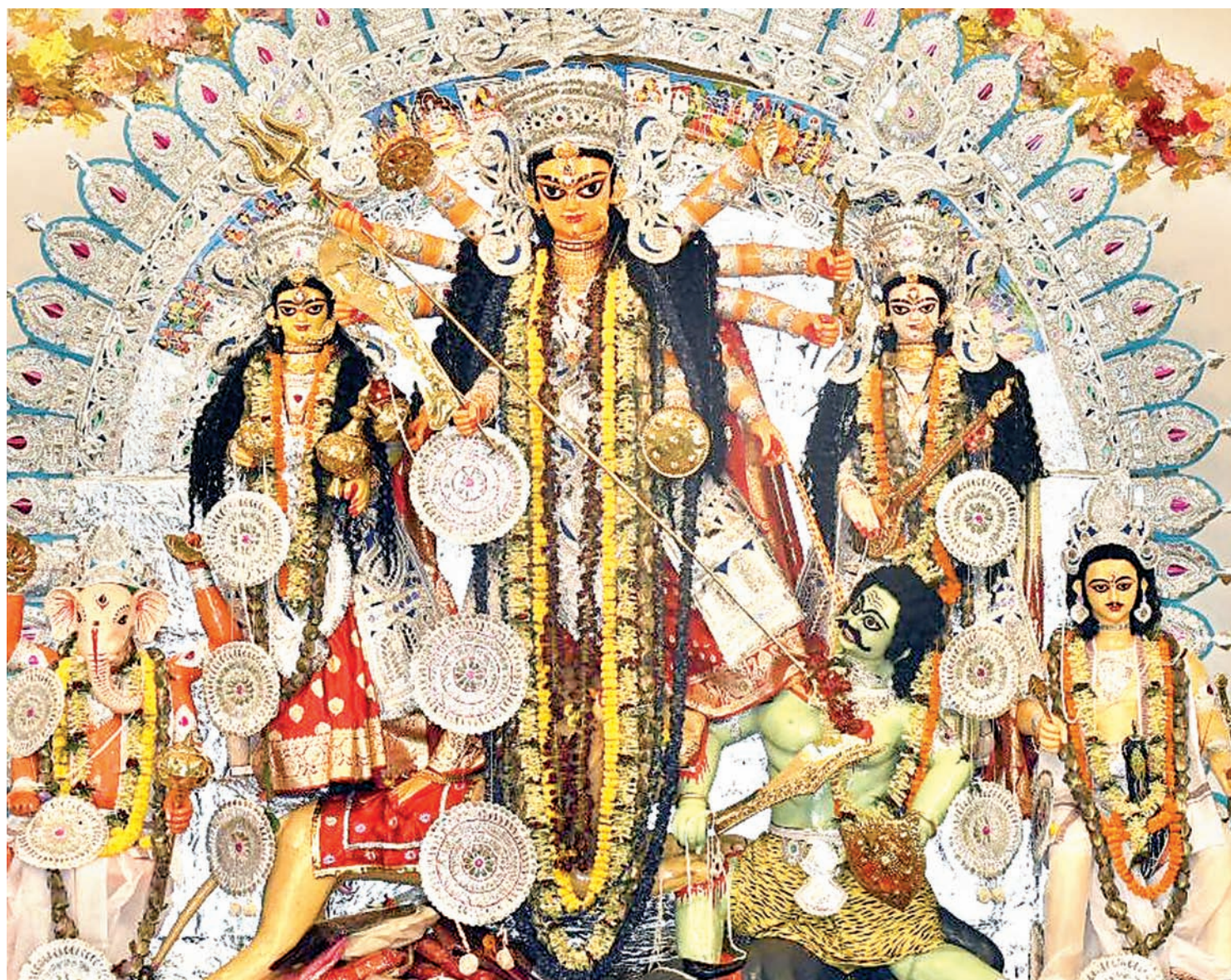
रांची की दुर्गाबाड़ी स्थित मां दुर्गा की भव्य प्रतिमा।

या देवी सर्वभूतेषु माँ महागौरी रूपेण संस्थिता ।। नमस्तस्यै नमस्तस्यै नमस्तस्यै नमो नमः ॥