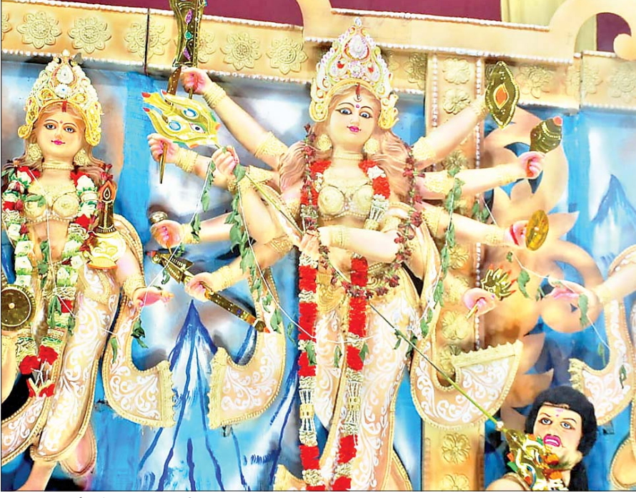
झरिया झरिया चौक में स्थापित मां दुर्गा की प्रतिमा।

धनबाद। कोयलांचल में दुर्गापूजा का उत्साह लोगों के सिर चढ़ कर बोलने लगा है। शनिवार को महासप्तमी पर मां दुर्गा के दर्शन और पूजा पंडालों को देखने के लिए जिले के विभिन्न क्षेत्रों में लोगों की भारी भीड़ पंडालों में उपड़ पड़ी। ऐसे में सुरक्षा और सड़क जाम से लोगों को निजात दिलाने के लिए प्रशासन भी कसर कसकर मैदान में कूद चुका है। ट्रैफिक व्यवस्था में बड़ा बदलाव भी किया गया है। शहर में भारी वाहनों के प्रवेश पर रोक लगा दी है। वहीं सभी पूजा-पंडालों से पहले ड्रॉप गेट भी बनाया गया है। कई जगहों पर वन-वे भी कर दिया गया है। इस बीच शनिवार को महासप्तमी की सुबह कोला बोड यानी नवपत्रिका की परंपरा को लेकर बंग समुदाय में खासा उत्साह दिखा। पालकी लेकर तालाब किनारे गए और वहां कोला बोड को स्नान कराया। नव