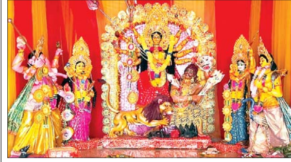
करकछ में स्थापित मां दुर्गा की प्रतिमा।