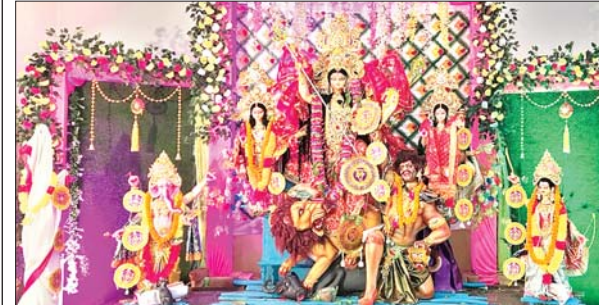
खलारी श्रीजानकी रमण मंदिर में स्थापित मां दुर्गा की प्रतिमा।