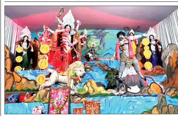
केडीएच में स्थापित मां दुर्गा की प्रतिमा।