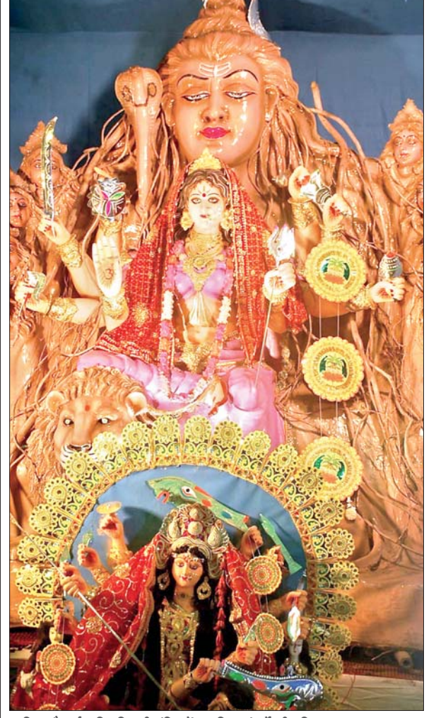
झरिया चौथाई कुलिह तिवारी मंदिर में स्थापित मां दुर्गा की प्रतिमा

फुसरो/बेरमो (आजाद सिपाही)। बेरमो के सभी क्षेत्रों में दुर्गापूजा पंडालों के पट खुल चुके हैं। मां के दरबार में श्रद्धालुओं का ताता लगा शुरू हो गया है। इससे पहले शनिवार को नवपत्रिका प्रवेश और स्थापना सप्तमी पूजा हुई। पुष्पांजलि और आरती में भी श्रद्धालुओं की भीड़ जुटी। इस दिन नवरात्र के सातवें दिन नौ कालरात्रि का ध्यान किया गया। ढोल-ढाक व धार्मिक गीतों से माहौल भक्तिमय हो गया है। करगली गेट स्थित दुर्गा मंडप, दोरी स्टाफ क्वार्टर, करगली बाजार आदि के पूजा पंडाल सहित विभिन्न जगहों से सुबह में पालकी के साथ जल यात्रा निकली। तालाब, पोखर व नदी में कोलाबाड व बेलबरण पूजा की गयी। मां को आद्वान कर पालकी में लाया गया। सुभाषनगर, जवाहरनगर, करगली तीन नंबर, फुसरो बैंक मोड़, फुसरी स्टेशन, बेरमो सीम, रामनगर, चलकरी बस्ती, पिछरी, सेंट्रल कॉलोनी मकोली सहित कई पूजा पंडालों में महासप्तमी की पूजा की गयी।