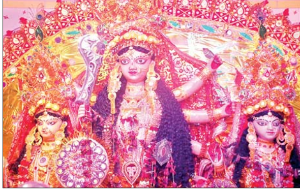
झरिया के पुराना राजागढ़ में स्थापित मां दुर्गा की प्रतिमा

गोल बिल्डिंग की तरफ से आने वाले वाहनों को कोला कुसमा मोड़ पर रोक जाएगा। झारखंड मैदान पूजा-पंडाल जाने के लिए हटिया मोड़, डीआरएम चौक होते हुए पंपू तालाब के रास्ते का प्रयोग करना होगा। धनबाद ब्लॉक, हीरापुर से भी वापसी का रास्ता रहेगा। वाच एंड वार्ड चौक से झारखंड मैदान पूजा-पंडाल की ओर नौ एंटी रहेगी। झरिया, मटकुरिया की ओर से आने वाले वाहन धनसार चौक, हावड़ा मोटर्स होते हुए मर्नटॉड पूजा-पंडाल और पुराना बाजार पूजा-पंडाल जाएंगे।