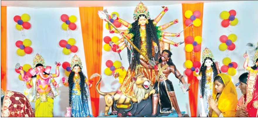
बचरा में स्थापित मां दुर्गा की प्रतिमा।

महासप्तमी पर देवी मंडप दुर्गा पूजा समिति द्वारा नवपत्रिका प्रवेश का लेकर भव्य कलश यात्रा