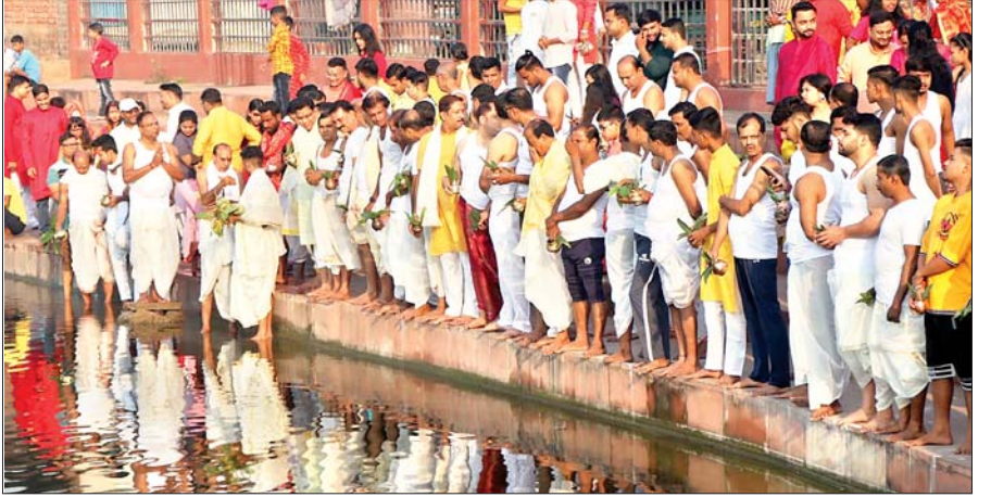
झरिया राजा तालाब में कोला बऊ को स्नान कराने के दौरान मौजूद श्रद्धालु।