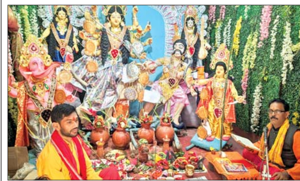
लपरा शिवमंदिर में स्थापित मां दुर्गा की प्रतिमा।