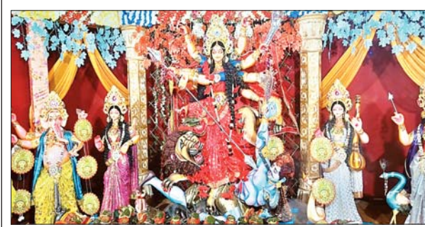
धमघमिया माइनस चौक में स्थापित देवी दुर्गा।