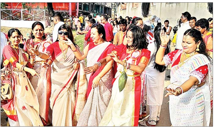
धनबाद में कोला बऊ शोभा यात्रा में नृत्य करती बंगाली कल्याण समिति की महिलाएं।