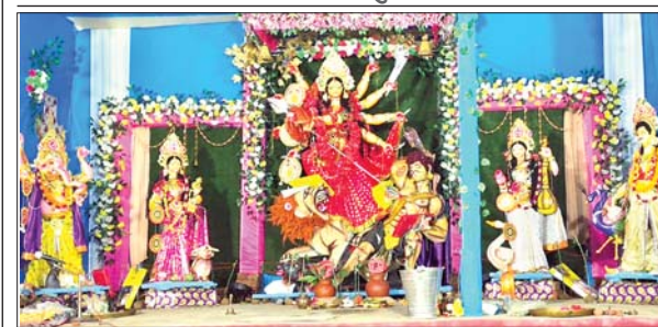
खलारी बाजारटांड में स्थापित मां दुर्गा की प्रतिमा।