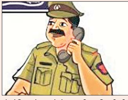
है, लेकिन पूरे मामले में उक्त वरीय अधिकारी की खूब किचकिरी हो रही है।

पुलिस सूत्रों ने बताया कि पूरे रामगढ़ में पुलिस विभाग के एक वरीय अधिकारी को खूब बदनाम किया जा रहा है। उनका नाम लेकर कुछ अधिकारियों को हड़काया जा रहा है। यह सब रामगढ़ में तैनात एक दारोगा कर रहा है। सूत्रों पर भरोसा करें, तो इस कहानी के पीछे एक अहम लॉजिक है। उक्त अधिकारी पहले भी कोयला तस्करों का स्वाद ले चुका है। इसलिए उसे पता है कि कोयले की कमाई में तपिश कितनी है। इसी को लेकर वह रामगढ़ में कोयला तस्करों की कमान अपने हाथों में लेना चाहता है, ताकि उसका रामगढ़ आने का सपना सच हो सके। हालांकि यह रणनीति कितनी कामयाब होगी, वह तो दूर की बात