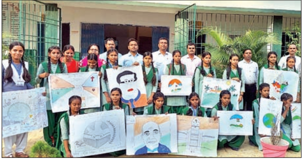
कलाकृतियों से एकता-अखंडता का संदेश देते स्कूली बच्चे।

आजाद सिपाही संवाददाता मेदिनीनगर। डालटनगंज केन्द्रीय संचार ब्यूरो की ओर से राष्ट्रीय एकता दिवस की पूर्व संध्या पर सोमवार को लेस्लीगंज प्लस टू हाई स्कूल में विभिन्न प्रतियोगिताओं का आयोजन किया गया। जहाँ विद्यार्थियों ने अपनी कलाकृति के माध्यम से देश की एकता और अखंडता का संदेश दिया। इससे पूर्व विद्यार्थियों को संबोधित करते हुए डालटनगंज केन्द्रीय संचार ब्यूरो के क्षेत्रीय