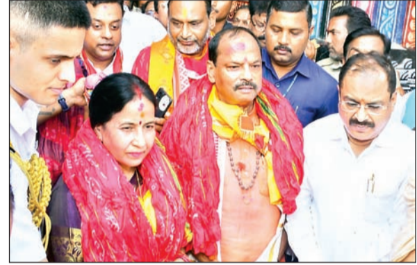
पुरी स्थित जगन्नाथ मंदिर में पत्नी संग दर्शन करने पहुंचे मनोनीत राज्यपाल रघुवर दास, रघुवर दास का स्वागत करते ओड़िशा के सीएम नवीन पटनायक।