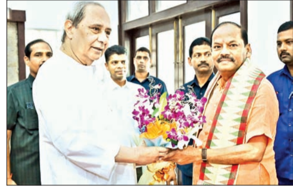
ग्रहण समारोह में झारखंड से उनके कई समर्थकों और उनके परिवार के सदस्यों के शामिल होने की संभावना है। बता दें कि राष्ट्रपति द्रौपदी मुर्मू ने 18 अक्टूबर को श्री दास को ओड़िशा का नया राज्यपाल नामित किया था।