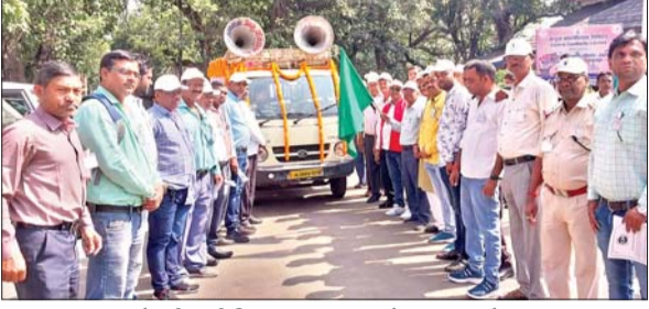
जागरूकता रथ को हरी झंडी दिखाकर रवाना करते गणमान्य लोग।