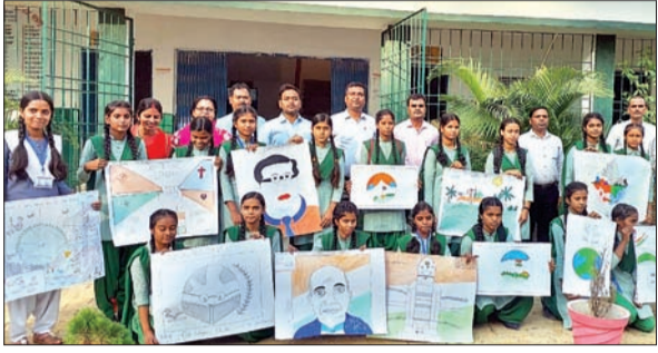
कलाकृतियों से एकता-अखंडता का संदेश देते स्कूली बच्चे।

आजाद सिपाही संवाददाता मेदिनीनगर। डालटनगंज केन्द्रीय संचार ब्यूरो की ओर से राष्ट्रीय एकता दिवस की पूर्व संध्या पर सोमवार को लेस्लीगंज प्लस टू हाई स्कूल में विभिन्न प्रतियोगिताओं का आयोजन किया गया। जहाँ विद्यार्थियों ने अपनी कलाकृति के माध्यम से देश की एकता और अखंडता का संदेश दिया। इससे पूर्व विद्यार्थियों को संबोधित करते हुए डालटनगंज केन्द्रीय संचार ब्यूरो के क्षेत्रीय