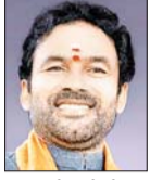
जी कृष्ण रेड्डी

यह देश प्राचीन सांस्कृतिक विरासत की ऐसी आधारशिला पर बना है, जहां वैदिक काल में हमें केवल एक ही मंत्र बताया जाता था, जिसे हमने सीखा है, जिसे हमने याद किया है - संगच्छ्व संवदस्व सं वो मनांसि जानताम् - हम साथ चलते हैं, हम साथ आगे बढ़ते हैं, हम साथ मिल कर सोचते हैं, हम मिल कर संकल्प लेते हैं और हम साथ मिल कर इस देश को आगे ले जाते हैं - नरेंद्र मोदी 2014 में, लाल किले की प्राचीर से प्रधानमंत्री नरेंद्र मोदी ने एक ऐसे भारत के लिए अपना विजन अर्थपूर्ण तरीके से सामने रखा, जहां विकास सिर्फ एक एजेंडा नहीं था, बल्कि प्रत्येक भारतीय का साझा लक्ष्य था। उन्होंने एक ऐसे भविष्य का संकेत दिया, जहां जनभागीदारी, हमारे सबसे मजबूत हथियार के रूप में और विश्व गुरु के रूप में सत्ता के शिखर पर हमारे दावे के रूप में उभरेगी।