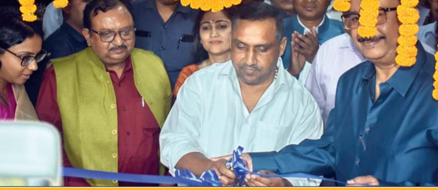
ओपीडी बेसिस पर मरीजों को डायलिसिस की सुविधा