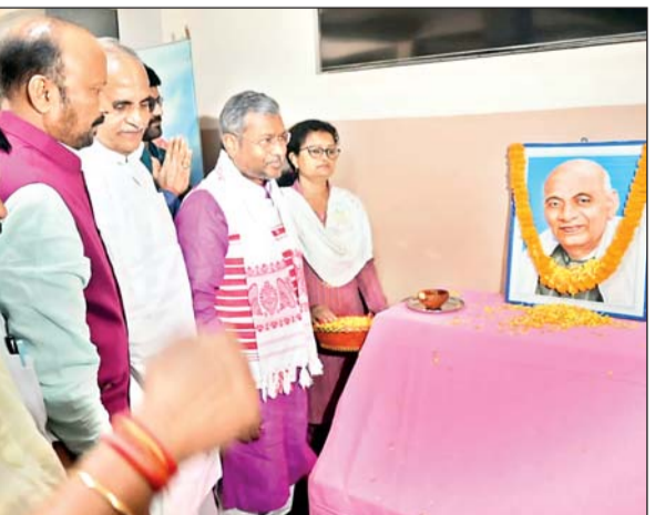
अश्रुणुण बनाये रखना चाहते थे। उन्होंने कहा कि प्रधानमंत्री नरेंद्र मोदी सरदार पटेल के सपनों

रांची। भाजपा प्रदेश अध्यक्ष बाबूलाल मरांडी ने मंगलवार को प्रदेश कार्यालय में भारत के प्रथम गृह मंत्री सरदार वल्लभ भाई पटेल की जयंती पर उन्हें श्रद्धासुमन अर्पित किये। श्री मरांडी ने कहा कि सरदार साहब भारत की राष्ट्रीय एकात्मता और सांस्कृतिक राष्ट्रवाद के प्रबल समर्थक थे।