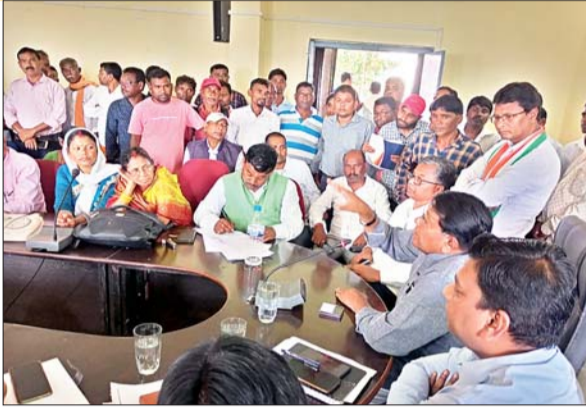
तमाड़ में जन सुनवाई में लोगों की समस्याएं सुनते मंत्री रामेश्वर उरांव।

तमाड़। झारखंड के वित्त मंत्री रामेश्वर उरांव गुरुवार को तमाड़ प्रखंड सभागार में आयोजित जनसुनवाई कार्यक्रम में हिस्सा लेने पहुंचे। इसके बाद प्राचीन दिउड़ी मंदिर पहुंचकर माता के चरणों में मत्था टेका और क्षेत्र की खुशहाली की कामना की। वहीं, जनसुनवाई के दौरान सैकड़ों लोग प्रखंड पहुंचे और अपनी-अपनी समस्याओं से अवगत कराते हुए आवेदन जमा किया। वहीं, वित्त मंत्री रामेश्वर उरांव ने बताया कि जनसुनवाई कार्यक्रम में कुल 54 मामले सामने आए हैं। इसमें