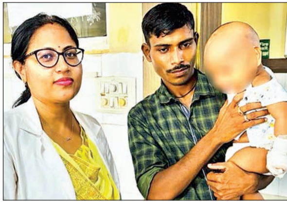
तुलना में काफी कम थी। किम्स से उपचार का लाभ उठाने का निर्णय