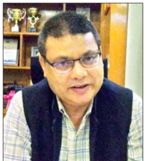
नगर आयुक्त रवि राज शर्मा

धनबाद (आजाद सिपाही)। नगर आयुक्त रवि राज शर्मा ने लोक आस्था के महापर्व छठ पूजा की तैयारी को लेकर कहा कि डीसी सह जिला दंडाधिकारी वरुण रंजन के निर्देशानुसार नगर निगम ने निगम क्षेत्र में छठ घाट चिह्नित कर वहां पर सफाई अभियान शुरू कर दिया गया है। दीपावली तक सभी तालाबों की सफाई पूरी करने का लक्ष्य रखा है। छठ तालाब के साथ-साथ प्रोच रोड की भी सफाई की जा रही है। दीपावली के बाद यदि तालाब गंदा होगा तो फिर से उसकी सफाई निगम द्वारा की जाएगी। छठ पूजा के दो दिन पहले तालाबों में ब्लीचिंग पाउडर और फिटकरी डाली जाएगी। जिससे पानी शुद्ध हो जाएगा। खतरनाक घाटों को चिह्नित कर वहां बैरिकेडिंग की जाएगी और जरूरत पड़ने पर एनडीआरएफ की टीम की उपस्थिति भी सुनिश्चित की जाएगी। वहीं पंपु तालाब, लोको टैक, रानी बांध, बेकार बांध, राजा तालाब, बिग बाजार के पास तालाब, झरिया राजा तालाब, विकास नगर छठ घाट में सर्वाधिक भीड़ होती है। इन जगहों पर तैराकों की तैनाती की जाएगी। नगर आयुक्त ने सभी नगर वासियों से तालाब को गंदा नहीं करने और स्वच्छ रखने तथा घर का कचरा एवं पूजन सामग्री को तालाब में नहीं डालने की अपील की है। उन्होंने कहा कि घर का जो भी कचरा है वह नगर निगम की घर-घर घूमने वाली गाड़ी में ही डालें।