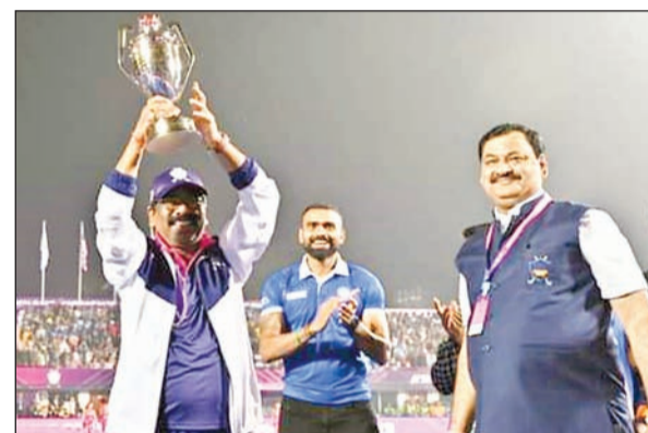
रविवार को झारखंड वीमेंस एशियन चैंपियंस ट्रॉफी के फाइनल मुकाबले से पहले ट्रॉफी हाथ में लिये जोश और उत्साह से लबरेंज मुख्यमंत्री हेमंत सोरेन।