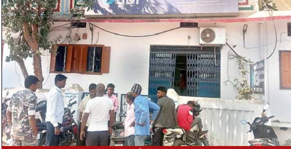
भारतीय स्टेट बैंक शाखा मनिका

आजाद सिपाही संवाददाता मनिका (लातेहार)। मनिका थाना क्षेत्र स्थित स्टेट बैंक मनिका में एक आदिवासी 16 वर्षीय नाबालिग युवक के साथ एसबीआई बैंक में कार्यरत फीलड मैनेजर के द्वारा दुष्कर्म करने का प्रयास किया गया। वहीं कुई गांव निवासी हाई स्कूल का छात्र भारतीय स्टेट बैंक में निकासी फार्म लेने आया हुआ था। पीड़ित