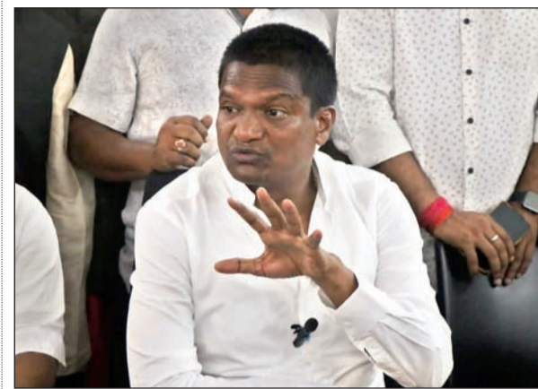
बाघमारा विधायक का बड़ा आरोप