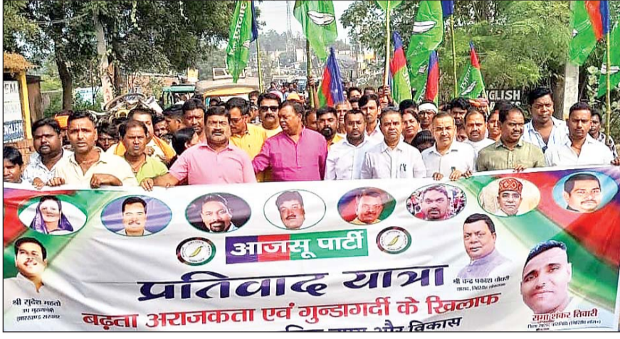
साथ लूटपाट हत्या की घटनाएं घट रही है। राज्य सरकार और जिला प्रशासन पूरी तरह फेल है। क्षेत्र में कोयले की लूट की जा रही है। इसमें जिला प्रशासन की

इस दौरान उन्होंने अपने संबोधन में कहा कि पूरे जिले में विधि व्यवस्था नाम का कोई चीज नहीं है, आये दिन व्यापारियों के