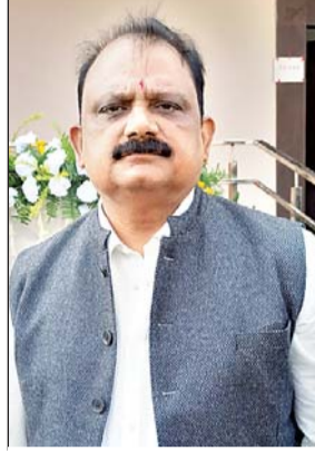
फोटो : मंत्री मिथिलेश ठाकुर

गढ़वा वासियों को मिला दिवाली का तोहफा, शहर में अब नहीं दिखेगा कच्ची सड़क करीब चार करोड़ रुपए की लागत से शहर के 43 कच्ची सड़कों का होगा पक्काकरण, मिली प्रशासनिक स्वीकृति