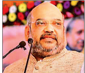
सभास्थल तक पहुंच गये थे। गौरतलब है कि मंगलवार शाम करीब 4-20 बजे परबतसर (नागौर) के बिड़ियाद गांव से चौपाल कर (छोटी सभा) कर गृह मंत्री रथ पर सवार हुए। उन्हें परबतसर के गणेश मंदिर स्थित सभास्थल तक जाना था। वहां से करीब एक किमी आगे आकर

आजाद सिपाही संवाददाता नागौर। केन्द्रीय गृहमंत्री अमित शाह बाल-बाल बचे। सभा स्थल की ओर जाते समय गृहमंत्री का रथ ऊपर से गुजर रही बिजली की तार को तोड़ता हुआ आगे बढ़ा। तेज चिंगारी के साथ तार नीचे सड़क पर आ गिरा। रथ को फौरन रोका गया और अमित शाह को दूसरी गाड़ी में बैठाकर रवाना किया गया। हादसा नागौर के परबतसर में हुआ। फिलहाल किसी को नुकसान नहीं पहुंचा है। केन्द्रीय मंत्री सकुशल अपनी