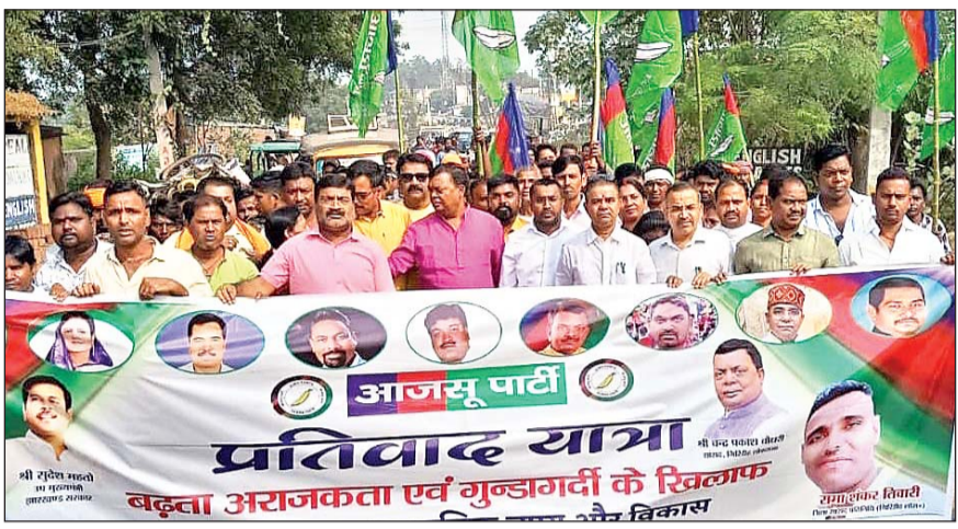
साथ लुटपाट हत्या की घटनाएं घट रही है। राज्य सरकार और जिला प्रशासन पूरी तरह फेल है। जिला प्रशासन के नेतृत्व में पूरे क्षेत्र में कोयले की लूट की जा रही है। इसमें जिला प्रशासन की

इस दौरान उन्होंने अपने संबोधन में कहा कि पूरे जिले में विधि व्यवस्था नाम का कोई चीज नहीं है, आये दिन व्यापारियों के