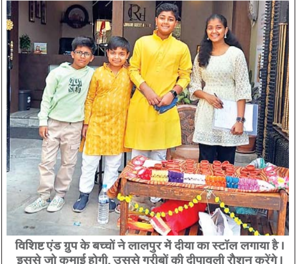
विशिश्ट एंड ग्रुप के बच्चों ने लालपुर में दीया का स्टॉल लगाया है। इससे जो कमाई होगी, उससे गरीबों की दीपावली रोशन करेंगे।