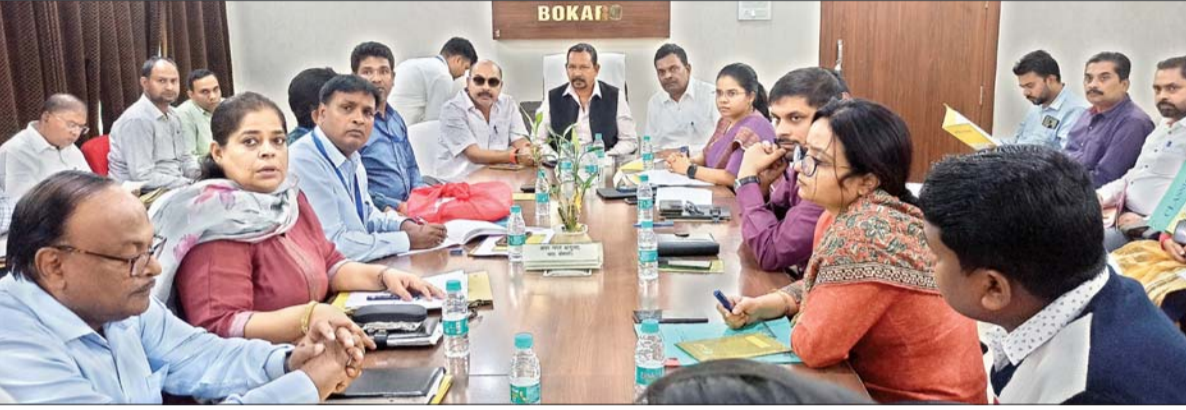
बोकारो सर्किट हाउस में अधिकारियों के साथ बैठक करते झारखंड विधानसभा की आश्वासन समिति की टीम।