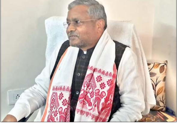
बाबूलाल मरांडी ने कहा कि इडी विलंब के विधिसम्मत कार्रवाई करें। मरांडी ने चाईबासा में मीडिया

चाईबासा। भाजपा प्रदेश अध्यक्ष और पूर्व मुख्यमंत्री बाबूलाल मरांडी ने मुख्यमंत्री हेमंत सोरेन पर निशाना साधा। उन्होंने कहा कि संवैधानिक पद पर रहते हुए भी हेमंत सोरेन कानून का माखौल उड़ा रहे हैं। पूछताछ करने के लिए इडी ने उन्हें पांच-पांच बार समन जारी किया, लेकिन वह इडी के समक्ष उपस्थित नहीं हुए।