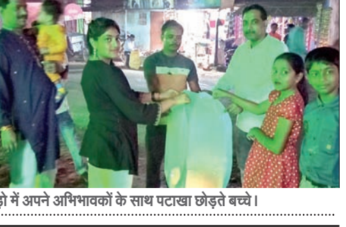
बेड़ो में अपने अभिभावकों के साथ पटाखा छोड़ते बच्चे।