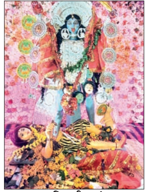
आजाद सिपाही संवाददाता

बेड़ो। प्रखंड मुख्यालय सहित प्रखंड के ग्रामीण क्षेत्रों में दीपावली का त्योहार हर्षोल्लास के साथ मनाया गया। दीपावली पर लोगों ने शाम को शुभ मुहूर्त में भगवान श्री गणेश और देवी मां लक्ष्मी की पूजा अर्चना किया। साथ ही लोगों ने अपने घर को दीया व रंग-बिरंगे लाइट से सजाकर भगवती मां लक्ष्मी व भगवान श्री गणेश का स्वागत किया। साथ ही दीपावली को लेकर लोगों ने अपने आंगन को रंग-बिरंगे रंगोली से सजाया। वहीं बच्चों में दीपावली को लेकर काफी उत्साह देखने को मिला। बच्चों ने मिट्टी व कार्टन का घर बनाकर पूजा की। साथ ही बच्चों ने रंग-बिरंगे पटाखें जलाकर दीपावली का आनंद लिया। इधर