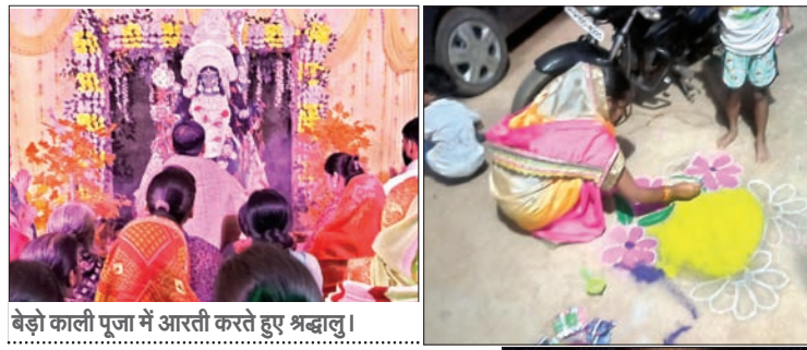
बेड़ो काली पूजा में आरती करते हुए श्रद्धालु।

लापुंग (आजाद सिपाही)। लापुंग प्रखंड में प्रकाश पर्व दीपावली और सोहराई पर्व हर्षोल्लास पूर्वक मनाया जा रहा है। 12 नवंबर को रात में दीपावली के अवसर पर सनातनी व सरना धर्मावलंबियों के घर घर मिट्टी दिए में करंज तेल से घर को रोशन किया गया। मठ मंदिरों को भी दीपों से रोशन किया गया इसके अलावे इलेक्ट्रॉनिक लाइट से भी घरों को रोशनी से जगमगाए गए। रात में धन की देवी लक्ष्मी गणेश की पूजा किया गया। फतेहपुर हनुमान व शिव मंदिर में 251 मिट्टी के दिए करंज तेल से युवा वाहिनी संघ फतेहपुर के युवाओं ने दीप जलाया। घरों के आंगन में रंगोली बनानी महिलाएं व बच्चियों को देखा गया। 13 व 14 नवंबर दोनो दिन गोवर्धन पूजा किया जा रहा है लोग गाय और बैल को नहलाकर फूल माला पहना कर उससे दाना खिलाते देखे गये। इसके अलावे अनेक सनातनी पुरानी पारम्परिक प्रथा कहे या रूढ़िवादी मुर्गे की बलि पूर्वजों की याद में देते हैं और पूरे परिवार उस मुर्गे की मांस को पकाकर कहते हैं। इस सोहराई पर्व के नाम पर निर्दोष सैकड़ों मुर्गे की बलि दी जाती है साथ में हड़िया का तपावन देने की प्रथा कायम है। इसमें सरना और सनातन दोनो धर्मावलम्बी मुर्गा की बलि और तपावन देने की प्रथा वर्षों से देते आ रहे हैं। लापुंग,ककरिया, लालगंज, बहुगाव, दोलैचा, देवगांव, मालगो,फतेहपुर के अलावे दर्जनों गांव में दीपावली व सोहराई पर्व मनाया गया।