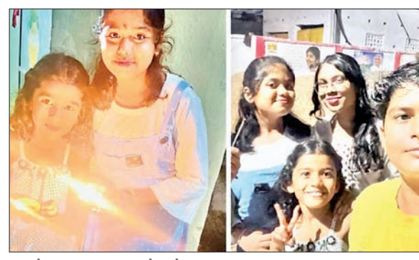
पटाखे जलाकर आनंद करते बच्चे।

पिपरवार। कोयलांचल व आसपास के ग्रामीण इलाकों में रौशनी का महापर्व दीपावली उत्साह और उमंग के साथ मनायी गई। दीपावली को लेकर पूरा क्षेत्र रौशनी से जगमगा उठा। हर चेहरे पर खुशियां झलक रही थी। बच्चों में गजब का उत्साह दिखा। बच्चों ने जमकर आतिशबाजी की। वहीं क्षेत्र के लोगों ने अपने-अपने घरों व दुकानों में विधिवत पूजा करायी और एक-दूसरे के घर जाकर मिठाई खिलाकर दीपावली की बधाई दी। लोगों ने अपने-अपने घरों में विद्युत सज्जा और फूल मालाओं से सजाया और दीपावली का जश्न मनाया। बच्चों से लेकर बड़ों तक सभी उत्साहित दिखे। पूरा इलाका