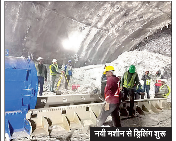
नयी मशीन से ड्रिलिंग शुरू

एक सौ घंटे बाद भी निकल नहीं पाये 40 मजदूर अब अमेरिकी मशीन से चले रहा बचाव कार्य