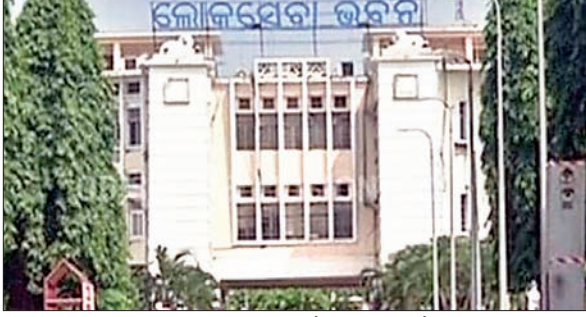
पिछले 14 नवंबर को आदिवासियों को जमीन के हस्तांतरण को लेकर कैबिनेट में फैसला लिया गया था। जिसका विपक्ष ने विरोध किया।

जनजाति वर्ग के लोग कृषि, आवासीय मकान निर्माण, बच्चों की उच्च शिक्षा, व्यवसाय या लघु उद्योग स्थापित करने के लिए अपनी जमीन गिरवी रखकर ऋण ले सकें। साथ ही, गैर-अनुसूचित जनजाति किसी व्यक्ति को संपत्ति हस्तांतरित कर सकती है। इस मामले पर कैबिनेट के फैसले के बाद इस पर राजनीति गरमा गयी थी। इस फैसले के बाद कांग्रेस और बीजेपी दोनों ने कड़ा विरोध किया था।