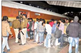
छठ को लेकर ट्रेन से बिहार अपने घर जाने वाले यात्रियों की भारी भीड़ उमड़ रही है। हालात ऐसे हो गए हैं रेलवे की सारी तैयारी फीकी पड़ रही है। ज्यादातर ट्रेनों में जनरल बोगी कम होने की वजह से स्लीपर में भी भीड़ उमड़ रही है। ट्रेनों में सवार होने के लिए लोगों को जट्टोजेद करते देखा जा रहा है। लोग आपातकालीन खिड़की का सहारा लेकर ट्रेन में घुस रहे हैं। खास कर बच्चे और महिलाओं को काफी परेशानियों का सामना करना पड़ रहा है। दूसरी ओर, सुरक्षा के लिहाज से जीआरपी और आरपीएफ पूरी तरह एलर्ट मोड पर हैं। ट्रेनों में सघन जांच अभियान चलाया जा रहा है।