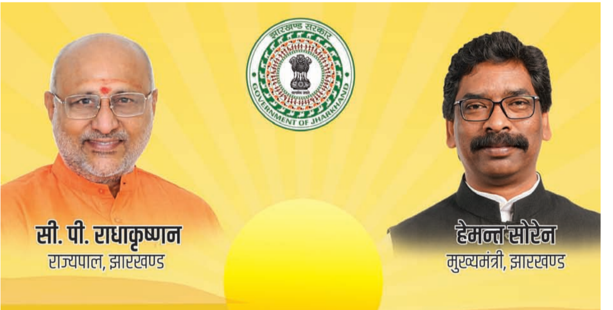
सी. पी. राधाकृष्णन राज्यपाल, झारखण्ड

कि आप पीएम मोदी के नेतृत्व में डबल इंजन सरकार बनाना चाहते हैं, या केसीआर के झूठ की सरकार। अमित शाह ने रैली के दौरान कहा कि अगर भाजपा की सरकार बनती है तो हमारा मुख्यमंत्री पिछड़े वर्ग से होगा। खुद प्रधानमंत्री नरेंद्र मोदी ने इसकी घोषणा की है। कांग्रेस और केसीआर दोनों पार्टियों ने टिकट देने में पिछड़े वर्ग के साथ अन्याय किया। भाजपा ने सबसे ज्यादा टिकट पिछड़े वर्ग को दिये हैं। पीएम मोदी के मंत्रिमंडल में पिछड़े वर्ग से 27 मंत्री हैं। मोदी सरकार ने ओबीसी आयोग को संवैधानिक मान्यता देने का काम किया है। कांग्रेस और टीआरएस दोनों ने पिछड़े वर्गों को धोखा दिया है।