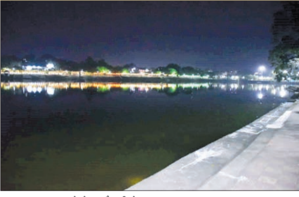
छठ पूजा को लेकर रौशनी से जगमगाता छठ घाट।