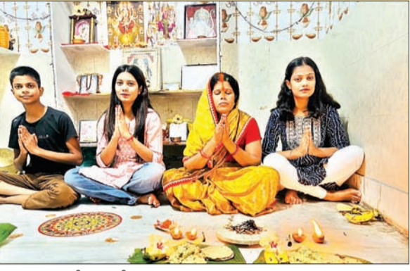
खरना व्रत करती छठ त्रिती।

छठ घाट सज-धज कर तैयार, त्रितियों का शुरु हुआ 36 घंटे का निर्जला उपवास