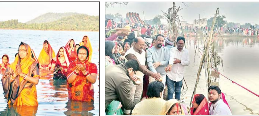
भगवान भास्कर को नमन करती छठव्रती महिलाएं।

पर युवाओं की टोली, समाजसेवी, जनप्रतिनिधि और विभिन्न छठ पूजा समिति के सदस्य दूध व फल का वितरण करते दिखे। व्रतियों की वापसी में प्रसाद मांगकर ग्रहण किया। इस दौरान शहरी क्षेत्रों में नगर निगम और ग्रामीण क्षेत्रों में नगर परिषद के कर्मियों के साथ प्रशासनिक व छठ पूजा समिति पदाधिकारी व सदस्य, स्थानीय पुलिस, शांति समिति सदस्य छठ घाटों पर व्यवस्था और सुरक्षा को लेकर सजग दिखे।