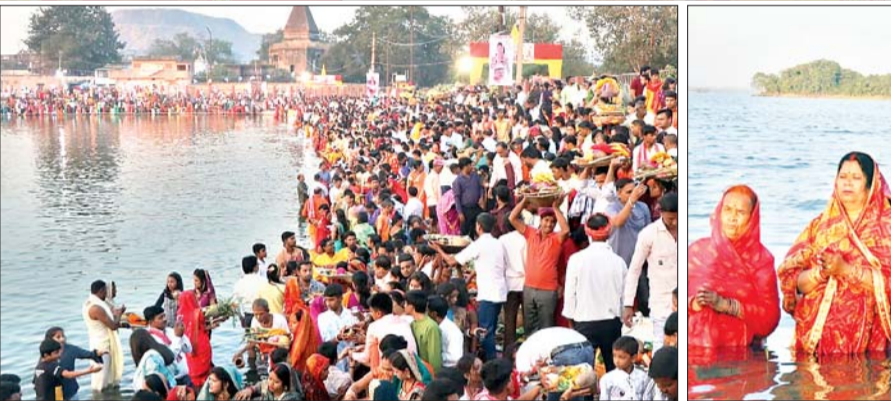
छठ घाट पर उमड़ा छठ व्रतियों का सैलाब।