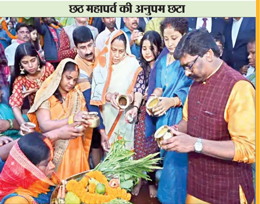
जो मंजर छठ में चार दिनों तक रहता है, वह 12 महीने रहे।