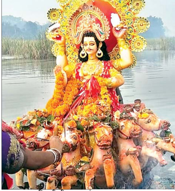
आजाद सिपाही टीम