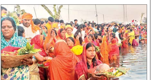
मोहननगर छठघाट पर उमड़ी श्रद्धालुओं की भीड़।

आजाद सिपाही संवाददाता खलारी। लोक आस्था व सूर्य उपासना का चार दिवसीय महापर्व छठ सोमवार को उदयमान सूर्य को अर्घ्य देने के साथ ही संपन्न हुआ। इससे पूर्व खलारी कोयलांचल सहित आसपास के क्षेत्रों में रविवार को छठ व्रतियों ने अपने नजदीक के नदी, तालाबों में स्थित छठ घाटों में अस्ताचलगामी सूर्य को अर्घ्य देकर भगवान भास्कर की पूजा की। क्षेत्र के खलारी के एसीसी छठ घाट, जेहलीटांड, केडी ओल्ड साईडिंग लंबा धौड़ा, मोहननगर, खिलान धौड़ा स्थित तलाबों में बने छठ घाटों और दामोदर नदी, सपही नदी एवं सोनाडुबी नदी में करकड़ा, धमधमियां, खलारी बाजारटांड, डकका, केडीएच, भुतनगर, मानकी, चूरी, सुभाषनगर, जामडीह सहित क्षेत्र के विभिन्न जगहों से पहुंचे छठ व्रतियों द्वारा भगवान सूर्य को अर्घ्य दिया गया। सभी छठ घाटों पर स्थानीय छठ पूजा समितियों व युवकों द्वारा साफ-सफाई और घाट को आकर्षक विद्युत सज्जा से सजाया गया था। छठ व्रतियों के रुकने के लिए टेंट की भी व्यवस्था की गई थी। वहीं एसीसी छठ घाट, मोहननगर छठ घाट तथा केडी ओल्ड साईडिंग लंबाधौड़ा छठ घाट, धमधमियां स्थित दामोदर छठ घाट, मानकी सपही नदी छठघाट सहित अन्य जगहों के