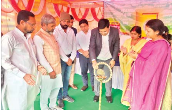
कार्यक्रम का उद्घाटन करते डीसी वरुण रंजन।

धनबाद। राज्य सरकार के चार वर्ष पूर्ण होने के उपलक्ष्य में शुक्रवार से जिले की पंचायत, नगर निगम के वार्ड एवं चिरकुंडा नगर परिषद के वार्ड में आपकी योजना आपकी सरकार आपके द्वार कार्यक्रम की शुरुआत की गई। इसी कड़ी में शुक्रवार को डीसी वरुण रंजन निरसा प्रखंड के बैजना में आयोजित कार्यक्रम में पहुंचे। डीसी ने दीप प्रज्वलित कर कार्यक्रम की शुरुआत की। उन्होंने मौजूद लोगों से अपील की कि अपने पंचायत में आहुत कार्यक्रम से जुड़कर सरकार द्वारा संचालित महत्वाकांक्षी योजनाओं का लाभ लें। डीसी, डीडीसी, डीएफओ, समाज कल्याण पदाधिकारी, बीडीओ एवं जप्रातिनिधियों द्वारा लाभुकों के बीच परिसंपत्तियों का वितरण किया गया। परिसंपत्ति वितरण में