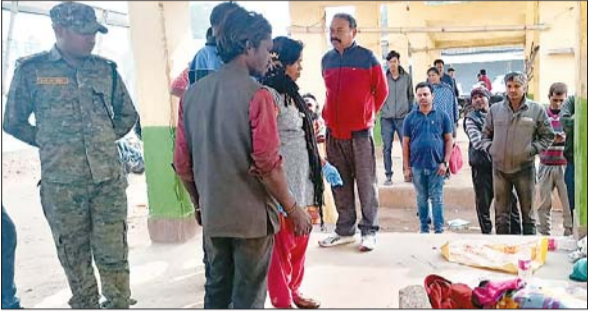
शव का पंचनामा कर जांच करती पुलिस।

आजाद सिपाही संवाददाता खूंटी। नगर पंचायत के घनी आबादी वाले बाजार टांड के एक शेड में शनिवार को एक आदिवासी महिला का शव बरामद होने से सनसनी फैल गई। महिला की हत्या किसी नुकली हथियार से वार कर किए जाने की आशंका है। पुलिस की प्रारंभिक जांच में हत्या के कारणों का खुलासा नहीं हो सका है। आशंका है कि नुकली चीज से हमले के बाद अत्यधिक रक्तस्राव के कारण उसकी मौत होई होगी। बताया जा रहा कि महिला के साथ एक पांच साल की बच्ची भी थी, जो लापता है। हालांकि शव की शिनाख्त नहीं हो सकी है। ना ही महिला की बच्ची की कोई जानकारी मिल सकी है। बाजार टांड के नागरिकों