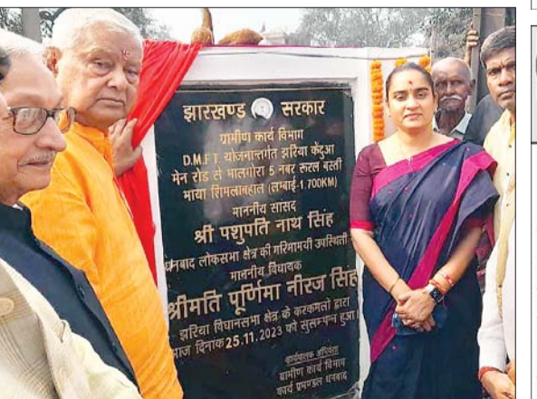
सड़ निर्माण कार्य का शिलान्यास करते सांसद पीएन सिंह, विधायक पूर्णिमा सिंह व अन्य।

धनसार। झरिया विधायक पूर्णिमा नीरज सिंह की अनुशंसा पर झरिया में डीएमएफटी फंड से स्वीकृत झरिया-केदुआ मुख्यमार्ग से भालगोड़ा 05 नंबर रूरल बस्ती तक भाया शिमलाबहाल पथ के निर्माण कार्य का शिलान्यास शनिवार को सांसद पशुपतिनाथ सिंह और विधायक पूर्णिमा नीरज सिंह ने संयुक्त रूप से किया। सांसद ने कहा कि धनबाद के विभिन्न क्षेत्रों में डीएमएफटी की योजना के तहत विकास कार्य किये जा रहे हैं। पूरे जिले में डीएमएफटी फंड से विकास कार्य में तेजी आया है। धनबाद मार्डनिंग क्षेत्र है और झारखंड में सबसे ज्यादा रेवेन्यू धनबाद से ही जाता है। जनता को सुविधा और लाभ मिलेगा। वहीं, निर्माण कार्य के संबंध में विधायक पूर्णिमा नीरज सिंह ने कहा कि यह पथ डीएमएफटी द्वारा स्वीकृत है।