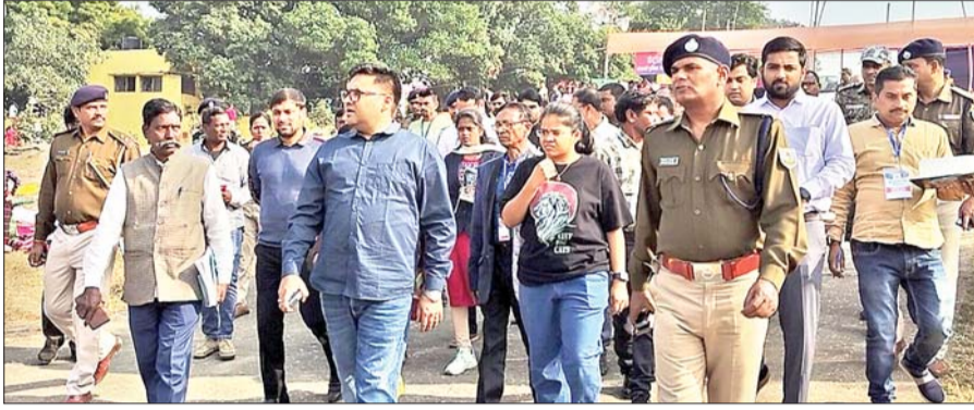
मुख्यमंत्री हेमंत सोरेन के आगमन को लेकर तैयारियों का जायजा लेते बोकारो डीसी, एसपी व अन्य।