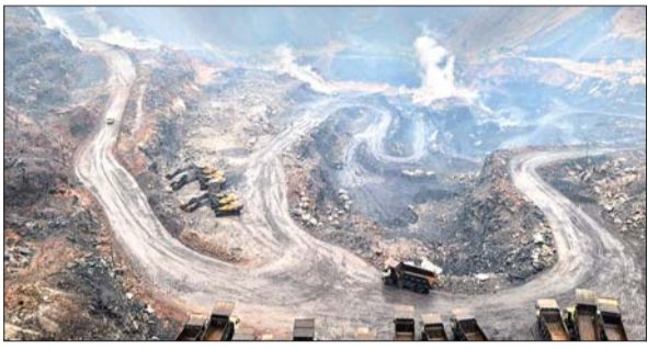
बारिश में भी अपने कर्मस्थान को जाती युवतियां।

धनबाद। बंगाल की खाड़ी में आये तूफान मिचौंग का धनबाद कोयलखन पर भी असर पड़ा है। विगत दो दिनों से रुक-रुक कर हो रही बारिश से पूरे जिले में जन जीवन अस्त-व्यस्त हो गया है। गुरुवार को भी आसमान में बादल छाए रहे और पूरे दिन बारिश होती रही। गुरुवार रात या शुक्रवार सुबह तक चक्रवात के कमजोर पड़ने की उम्मीद है। हालांकि शुक्रवार को भी बादल छाए रह सकते हैं। पर बारिश की संभावना नहीं के बराबर है। शनिवार से मौसम साफ होने का अनुमान है। इससे पूरे क्षेत्र से आनेवाली हवा शांत हो जाएगी और उत्तरी हवा का प्रभाव बढ़ेगा। उत्तर से आनेवाली हवा अपने साथ हिमालय से ठंड लेकर आएगी। सर्द हवा चलने व आसमान साफ होने पर रात के तापमान में तेजी से गिरावट आएगी। रविवार रात से ठंड बढ़ने की संभावना है।