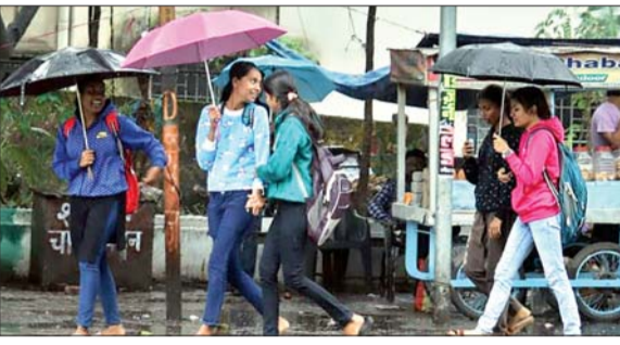
लगातार बारिश के चलते कोयला खनन स्थल से उरता धुआं।