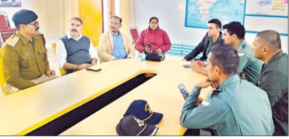
उपराष्ट्रपति जगदीश धनखड़ के धनबाद आगमन की तैयारियों को लेकर बैठक करते वरिष्ठ अधिकारी। हेलिकॉप्टर लैंडिंग का हो रहा अभ्यास।