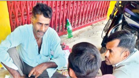
पंजाब नेशनल बैंक के मुख्य द्वार पर बैठा विचौलिया

पैसा लेकर केवाइसी नहीं कराने वाले बिचौलिया को खाताधारक ने धुना