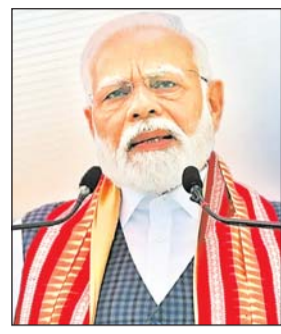
आसपास नहीं पहुंच सका। सर्वे के अनुसार, 76 प्रतिशत लोगों ने पीएम मोदी का समर्थन

आजाद सिपाही संवाददाता नयी दिल्ली। प्रधानमंत्री नरेंद्र मोदी को विश्व का सबसे लोकप्रिय नेता करार दिया गया है। बिजनेस इंटेलिजेंस कंपनी मॉनिंग कंसल्ट सर्वे में यह दावा किया गया है। अमेरिकी स्थिति कंसल्टेंसी फर्म मॉनिंग कंसल्ट की अप्रैल रेटिंग ट्रेकर के अनुसार, 76 प्रतिशत लोगों ने पीएम मोदी की नेतृत्व क्षमता को सराहा। गौरतलब है कि दुनिया का कोई अन्य नेता पीएम मोदी के