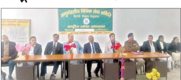
राष्ट्रीय लोक अदालत में उपस्थित गणमान्य लोग।

तेनुघाट। दिल्ली के सर्वोच्च न्यायालय, झारखंड उच्च न्यायालय एवं बोकारो के प्रधान जिला एवं सत्र न्यायाधीश के निर्देशानुसार शनिवार को तेनुघाट व्यवहार न्यायालय में आयोजित राष्ट्रीय लोक अदालत में कुल 64,515 मामलों का निष्पादन हुआ। जिससे करीब 42 करोड़ रुपये के समझौता राशि की प्राप्ति