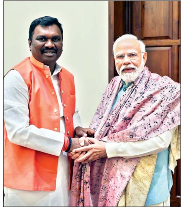
सभी 14 सीटों पर भाजपा की जीत होगी। झारखंड विधानसभा चुनाव में भी बहुमत के साथ एनडीए की सरकार बनेगी।