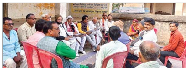
फोटो : बैठक में शामिल पूर्व मंत्री और अन्य

बैठक में बिहार प्रदेश के पूर्व मुख्यमंत्री जननायक कर्पूरी ठाकुर का 24 जनवरी 2024 को शताब्दी वर्ष के मौके पर कार्यक्रम आयोजन करने और सदैव रूप से कार्य करने के लिए कमिटी का गठन किया गया। इसके अलावा बैठक में कई प्रस्ताव लिये गये, जिसमें कमिटी का नाम जननायक कर्पूरी ठाकुर कमेटी चेतना मंच रखने का निर्णय लिया गया। इस कमिटी में एक संरक्षक मंडल