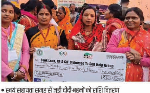
स्वयं सहायता समूह से जुड़ी दीदी-बहनों को राशि वितरण

सबल बनीं दीदी-बहनों, सुनिश्चित हुआ आजीविका का आधार झारखण्ड / धनबाद क्रेडिट लिंज के माध्यम से मदद कर रही है हेमन्त सरकार। धनबाद प्रखण्ड के गोपीनरथदीह पंचायत में आयोजित शिविर के दौरान जेएचएलपीएस अंतर्गत गतिवि एवं संचालित स्वयं सहायता समूह को 20 लाख 33 हजार का ऋण स्वयं सहायता समूह की दीर्घियों को दिया गया। दीर्घियों ने बताया कि ऋण राशि का प्रयोग वे गोपालन, बकरी पालन, राशन