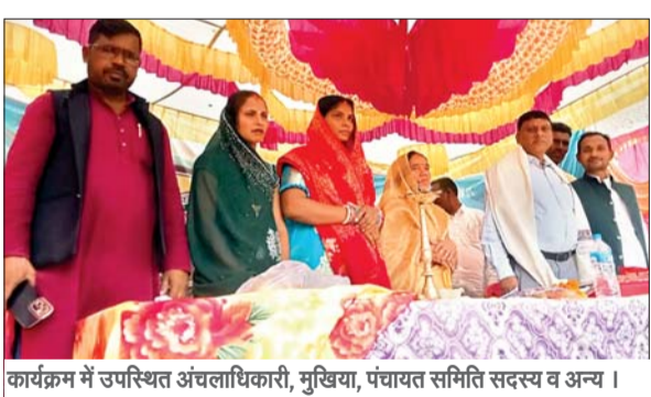
कार्यक्रम में उपस्थित अंचलाधिकारी, मुखिया, पंचायत समिति सदस्य व अन्य ।

हुसैनाबाद। आपकी योजना-आपकी सरकार-आपके द्वार कार्यक्रम अंतर्गत बुधवार को हुसैनाबाद प्रखंड के पोल्डीह पंचायत के बेदौलीया में शिविर