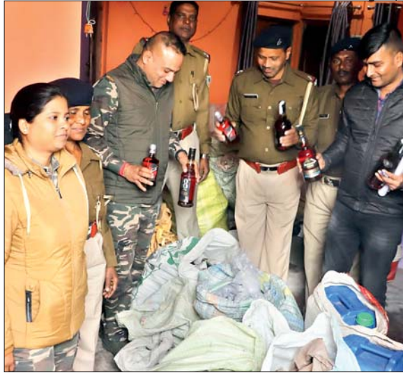
अवैध शराब की भट्टी में छापामारी के बाद जब्त शराब।

धनबाद। नव वर्ष और क्रिसमस के त्योहार को लेकर उत्पाद विभाग पूरी तरह रेस है। इसको लेकर अवैध शराब धंधेबाजों के खिलाफ कार्रवाई तेज कर दी है। मंगलवार को गुप्त सूचना के आधार पर उत्पाद विभाग ने धनबाद सदर थाना क्षेत्र के हीरापुर प्रेमनगर में किराए के मकान में छापामारी कर नकली शराब की मिनी फैक्ट्री का उद्घेदन किया है। छापामारी के दौरान विभाग ने मौके से लगभग डेढ़ लाख रुपये के नकली शराब बरामद किया। वहीं लगभग 70 लीटर स्पिरिट और 80 लीटर नकली शराब बरामद कर