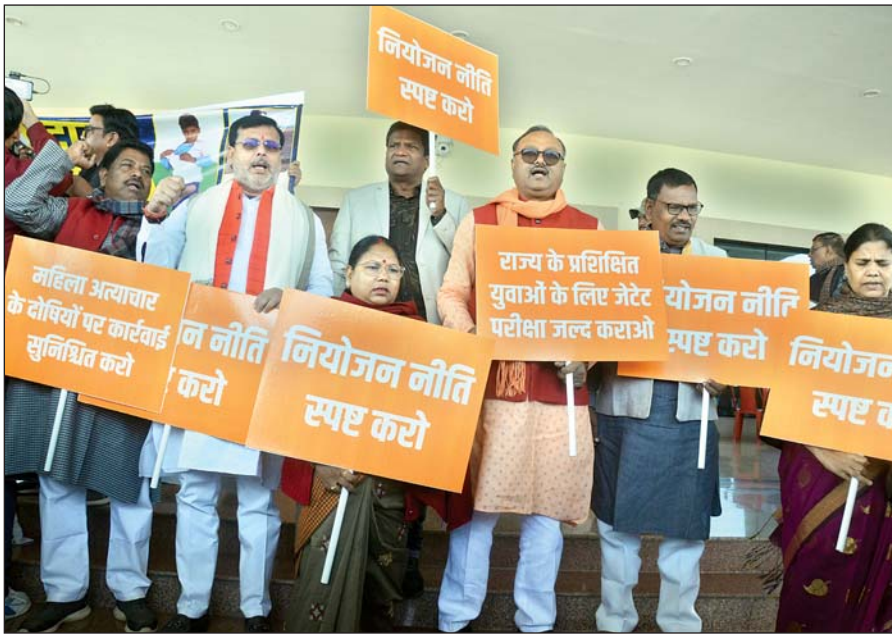
नियोजन नीति नहीं होने के कारण परीक्षाएं रद्द हो रही हैं। युवाओं का भविष्य दांव पर लगा है।