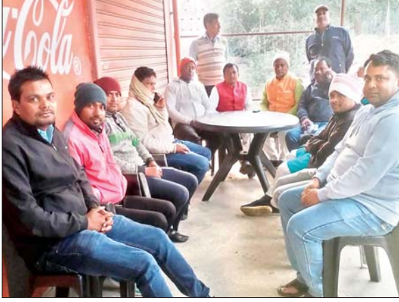
बैठक में उपस्थित अनगड़ा और नामकुम के प्रतिनिधि।

अनगड़ा। झारखंड में धर्मांतरित व्यक्तियों को अनुसूचित जनजाति का आरक्षण एवं अन्य सुविधा नहीं मिले इसको लेकर जनजाति सुरक्षा मंच के बैनर तले आगामी 24 दिसंबर को मोरहाबादी मैदान में डिलिस्टिंग महारैली का आयोजन किया गया है, जिसे सफल बनाने को लेकर मंगलवार को होटल राजधानी गोंदलोपोखर में अनगड़ा एवं नामकुम प्रखण्ड के प्रतिनिधियों की एक संयुक्त बैठक हुई। इसमें खिजरी के पूर्व