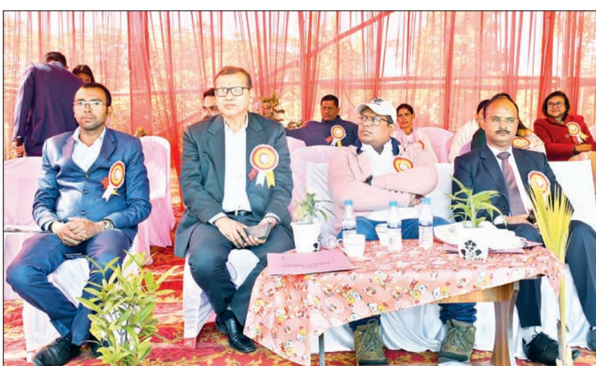
वार्षिक महोत्सव के दौरान मंच पर बैठे अतिथिगण।