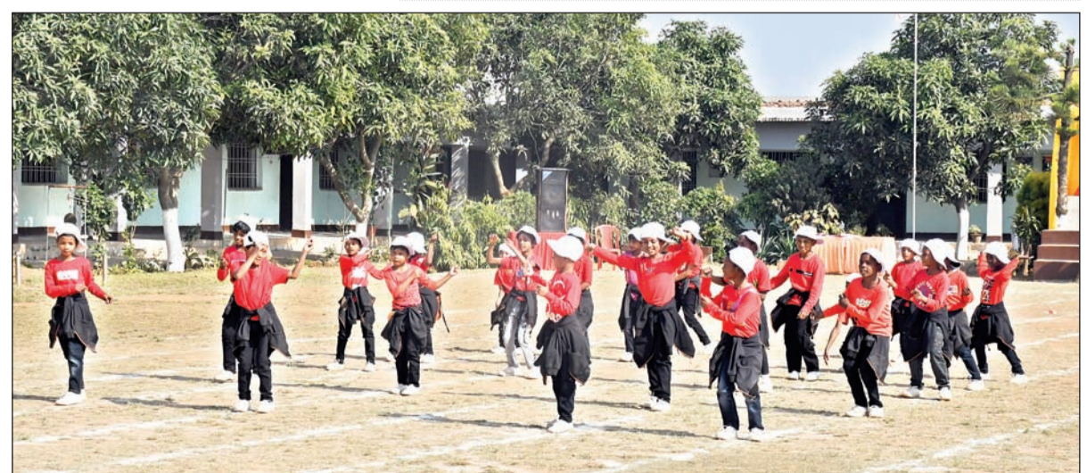
विद्या मंदिर पब्लिक स्कूल के वार्षिक महोत्सव में डांस करते स्कूल के छात्र।