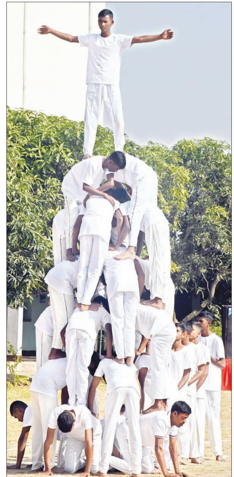
स्कूल के कार्यक्रम के दौरान पिरामिड की शक्ल में स्कूल के छात्र।