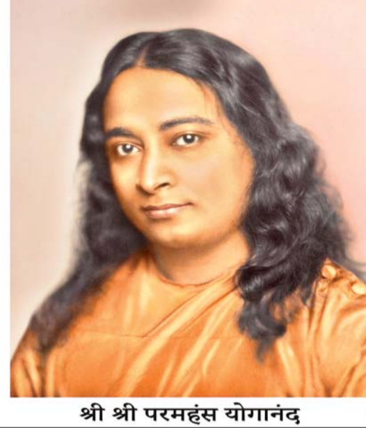
श्री श्री परमहंस योगानंद

भगवान श्रीकृष्ण (गुरु अथवा जाग्रत आत्मचेतना अथवा ध्यान से उत्पन्न अंतर्ज्ञान) की सहायता से, अपने राज्य को अहंकार और उसकी बुरी मानसिक प्रवृत्तियों की सेना के अधिकार से मुक्त कराने के लिए और ब्रह्म की सर्वसंतुष्टिदायक संप्रभुता स्थापित करने के लिए भौतिक, मानसिक और आध्यात्मिक युद्ध आवश्यक है।