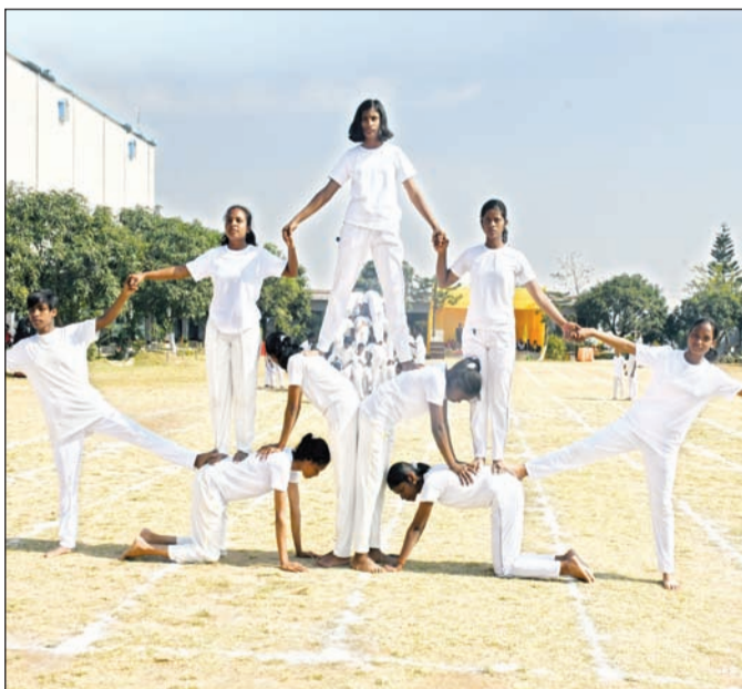
विद्या मंदिर पब्लिक स्कूल के वार्षिक महोत्सव में करतब दिखाती लड़कियां और स्लो साइकिलिंग करते छात्र।