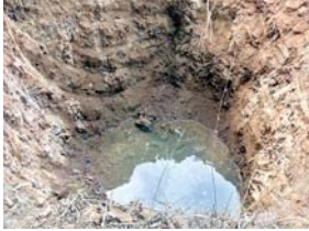
जेसीबी मशीन से खोदा गया कूप और जानकारी देता लाभुक।