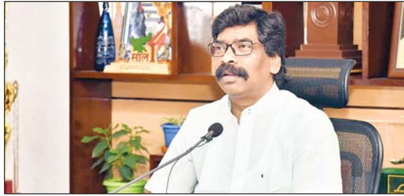
: कार्यक्रम के दौरान राज्य सरकार कई योजनाओं का शुभारंभ करेगी। नयी परियोजनाओं का शिलान्यास, पूर्ण हो चुकी योजनाओं का उद्घाटन, नियुक्ति पत्र का वितरण और फोकस्ड स्कीम के लाभार्थियों