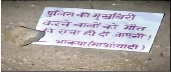
नक्सलियों द्वारा की गई पोस्टरबाजी।