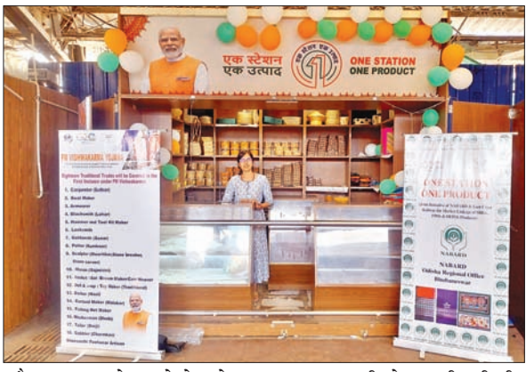
और कल्याण को बढ़ाने के उद्देश्य से वन स्टेशन-वन प्रोडक्ट

आजाद सिपाही संवाददाता भुवनेश्वर। भुवनेश्वर और खोरधारोड रेलवे स्टेशनों पर वन स्टेशन वन प्रोडक्ट स्टॉल अब राष्ट्रीय कृषि और ग्रामीण विकास बैंक (नाबाड) द्वारा प्रवर्तित किसानों और कारीगरों के उत्पादों के साथ प्रदर्शित किए गये हैं। इन उत्पादों में हथकरघा, हस्तशिल्प और उपभोग्य उत्पाद जैसे घोंडा चना, हरा चना, काला चना, शहद आदि शामिल हैं। भारत सरकार द्वारा स्थानीय कारीगरों, कुम्हारों, बुनकरों/हथकरघा बुनकरों, आदिवासियों आदि की आजीविका