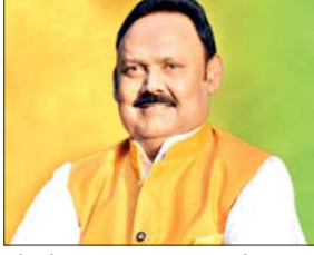
जोड़ने व सुलभ आगमन के लिए

कहा- इस योजना के शुरू होने से ग्रामीणों को सस्ती दर पर मिलेगा परिवहन सेवा का लाभ आजाद सिपाही संवाददाता