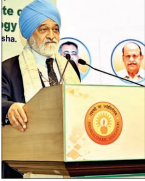
आधारित प्रगति के साथ आवश्यक आसन्न संरचनात्मक परिवर्तनों पर भी प्रकाश डाला। उन्होंने नवाचार को बाधित किए बिना नयी प्रौद्योगिकी को एकीकृत करने के लिए एक संतुलित नीति दृष्टिकोण की वकालत की और कमजोर आबादी की नौकरियों तक पहुंच सुनिश्चित करने के महत्त्व पर जोर दिया। उन्होंने अर्थशास्त्रियों से इन

आजाद सिपाही संवाददाता भुवनेश्वर। इंडियन इकोनॉमिक एसोसिएशन (IEA) सम्मेलन का 106वां संस्करण महत्वपूर्ण आर्थिक पहलुओं, प्रौद्योगिकी और नीति-निर्माण के उभरते परिदृश्य पर प्रकाश के साथ शुरू हुआ। उद्घाटन सत्र में मुख्य अतिथि के रूप में बोलते हुए, प्रसिद्ध अर्थशास्त्री और भारत के योजना आयोग के पूर्व उपाध्यक्ष डॉ. मोटिक सिंह अहलुवालिया ने प्रतिस्पर्धी हितों के बावजूद भारतीय लोकतंत्र की ताकत, बदलती सरकारों के बावजूद नीतिगत निरंतरता सुनिश्चित करने को रेखांकित किया। उन्होंने निर्णय लेने की प्रक्रियाओं को प्रभावित करने में तकनीकी दिग्गजों की बढ़ती भूमिका पर जोर देते हुए, विकसित हो रही प्रौद्योगिकी के प्रभाव पर प्रकाश डाला। डॉ. अहलुवालिया ने प्रौद्योगिकी