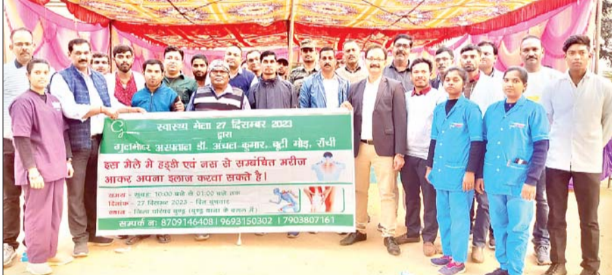
बुड़ु में आयोजित स्वास्थ्य मेला में उमड़ी भीड़।

इसके साथ पारंपरिक वाद्य यंत्रों मांदर 300 और नगाड़े 100 का वितरण किया गया है। वर्तमान समय में अबुआ आवास तीन कमरों का, जो गरीबों के लिए काफी लाभदायक साबित हो रहा है। राशन कार्ड से अनाज के