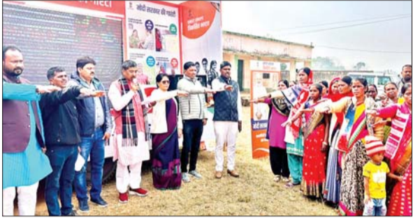
केंद्रीय योजनाओं की जानकारी देते राज्यसभा सांसद आदित्य साहू व अन्य।

आजाद सिपाही संवाददाता मंडर। विकसित भारत संकल्प यात्रा के तहत बुधवार को मंडर प्रखंड के लोयो स्कूल भवन में कार्यक्रम आयोजित की गई। जिसमें केंद्र सरकार द्वारा चलाई जा रही विभिन्न कल्याणकारी योजनाओं के संबंध में मौके पर उपस्थित लोगों को विस्तृत जानकारी दी गई। कार्यक्रम में शामिल भाजपा के राज्यसभा सांसद आदित्य साहू ने कहा कि केंद्र सरकार समाज के दुर्गम क्षेत्रों में भी योजनाओं को पहुंचा रही है। केंद्र सरकार हर वर्ग का ध्यान