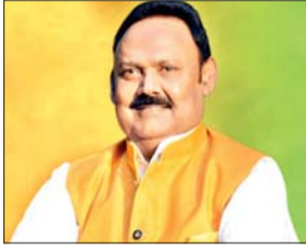
जोड़ने व सुलभ आगमन के लिए

कहा- इस योजना के शुरू होने से ग्रामीणों को सस्ती दर पर मिलेगा परिवहन सेवा का लाभ आजाद सिपाही संवाददाता