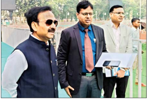
आयोजन भव्य तरीके से बिना किसी परेशानी से संपन्न हो। इसको लेकर हर एक तैयारी का

उन्होंने अब तक की तैयारियों की जानकारी लेते हुए सभी संबंधित पदाधिकारियों को आवश्यक दिशा-निर्देश दिये। अधिकारियों से कहा कि यह