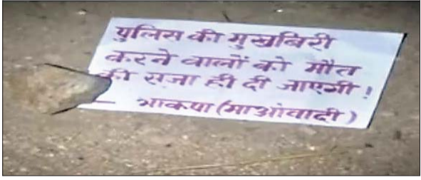
नक्सलियों द्वारा की गई पोस्टरबाजी।