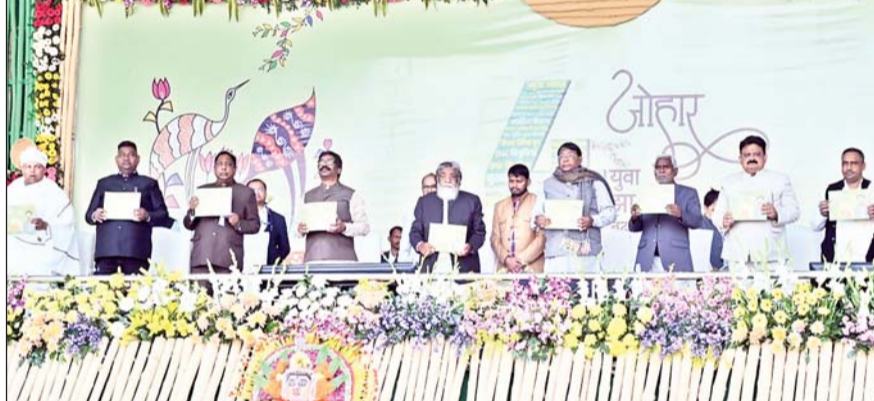
12815 योजनाओं की मिली सौगात | मुख्यमंत्री ने 24 नवंबर से शुरू हुए आपकी योजना. आपकी सरकार. आपके द्वार के तीसरे चरण के अंतर्गत सभी 24 जिलों में आयोजित कार्यक्रमों में लगभग 9268 करोड़ रुपये की लागत से 12815 योजनाओं का उद्घाटन, शिलान्यास किया।