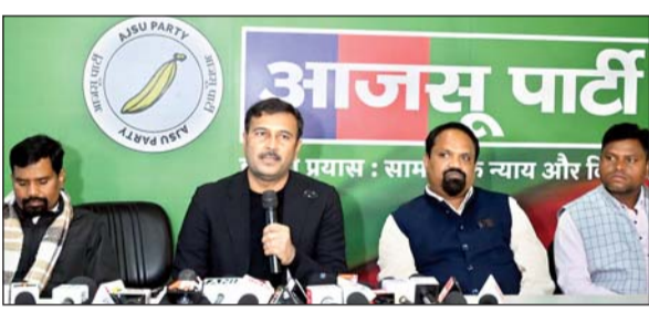
पारा शिक्षक सड़क पर थे, आज भी सड़क पर हैं। चार साल पहले भी 1932 का खतियान राज्य में लागू नहीं था, आज भी लागू नहीं है। चार साल पहले भी पिछड़े वर्गों को सरकारी नौकरियों में 27 प्रतिशत का आरक्षण नहीं था, आज भी नहीं है। चार साल पहले भी राज्य के युवा रोजगार के लिए सड़कों पर थे, आज भी हैं। यह हालात साफ बताते हैं कि हेमंत सरकार जनता के साथ षड्यंत्र कर रही है।